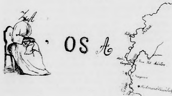
«Kosmos» műintézet nyomása Budapest, VI. Aradi-utca 8.