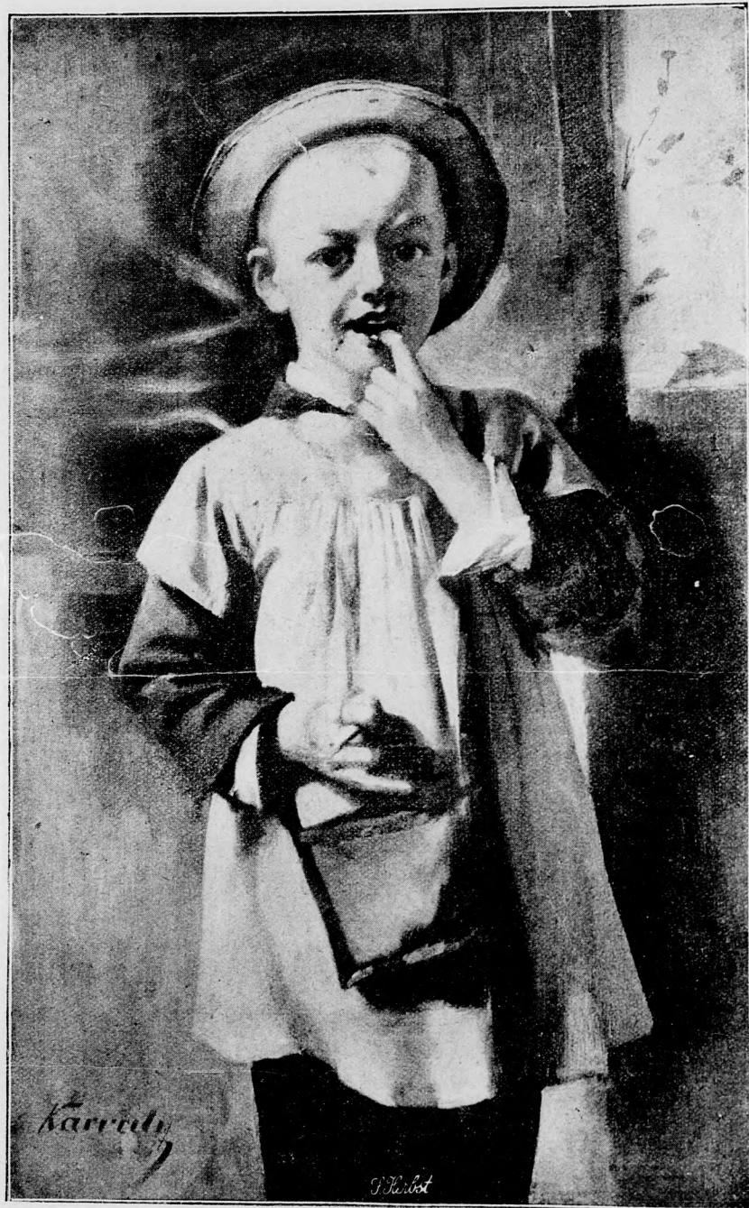
A kis torkos.