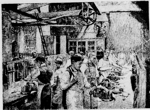
A kézimunkaiskolában. Lakatos és fémező műhely.

Magyarországon. Rendes tanulóul fölvétetnek azok a 15 évet betöltött ifjak, a kik az iparos tanulók számára szervezett iskola 3 évi tanfolyamát jó osztályzattal elvégezték, vagy a kik a gimnázium, realiskola vagy polgári iskola 4 alsó osztályából jó sikerű bizonyítványt nyertek. Itt a rendes tanítási tárgyak mellett szaktárgyakat is adnak elő. Az alsó osztályoknak az a céljük, hogy fölébresszék és előmozdítsák a tanulónak hajlamát és képességét valamelyik mesterségre, ép azért a növendékek közösen végeznek könnyebb fa és fém-munkákat. A következő tanfolyamokon aztán a fiatal embereket a magukválasztotta külön mesterségekre: építészetre, lakatos és műlakatos munkára, kőfaragásra, közönséges és műasztalosásra, esztergályosságra, fametszésre, ötvösségre stb. kiképezik, valamint kereskedelmi földrajzra, áruismérelés és ilyen egyéb tárgyakra tanítják. Gondoskodnak a jó-