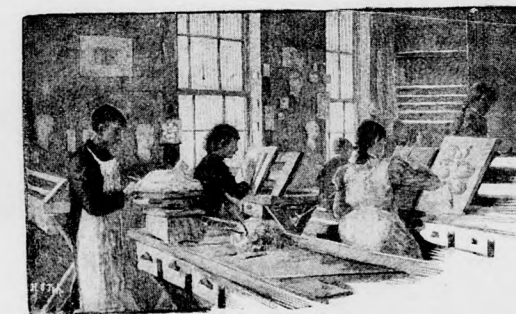
A kézimunkaiskolában. A mintázóterem.

Hány okos és eszes fiatal ember küszködik a nyomorusággal esztendő hosszú során át, míg végre vizsgájáig juthat! Pedig sokkal kevesebb fáradsággal és sokkal előbb biztos állást vívhattak volna ki maguknak, ha helyes úton valamely iparág üzésére szánták volna magukat. Igaz, a kézimunka közmondásos aranytermő talaja sokat vesztett jelentőségben, mióta versenyre szállt vele a gyárimunka; ám azért még mindig biztos és gyakran kitünő existenciát nyújt azoknak, a kik haladó korszakunk követelményeinek megfelelnek és a kívánatos ismereteket elsajátítják. Sok-sok példa mutatja, hogy kicsi kezdeményezésekből nagyszerű és óriási üzletek álltak elő; az pedig tény, hogy a gyáripár a műipart soha