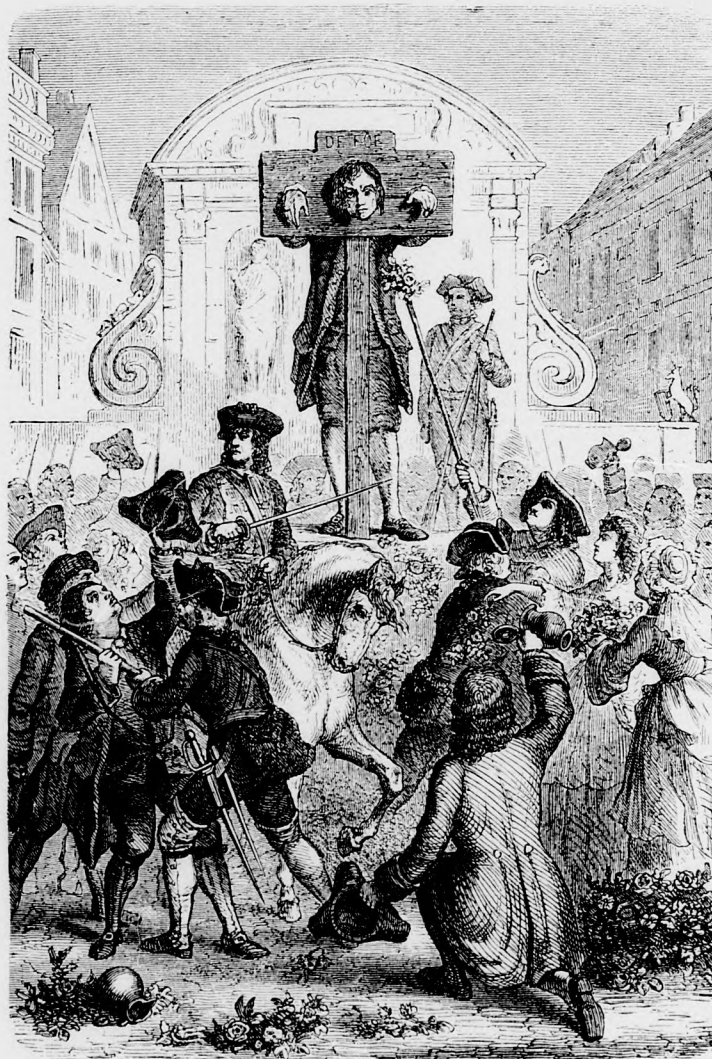
DEFOE A PELLENGÉREN.

Csak annyi az egész, hogy egy fiatal, tapasztalatlan tengerész hajótörést szenved, pusztá szigetre vetődik, itt éldégél évek hosszú során át, míg végre hajó köt ki szigetén s haza viszi Angliába. És ez a száraz mese hány ifjú szívet megdobogtatott már!