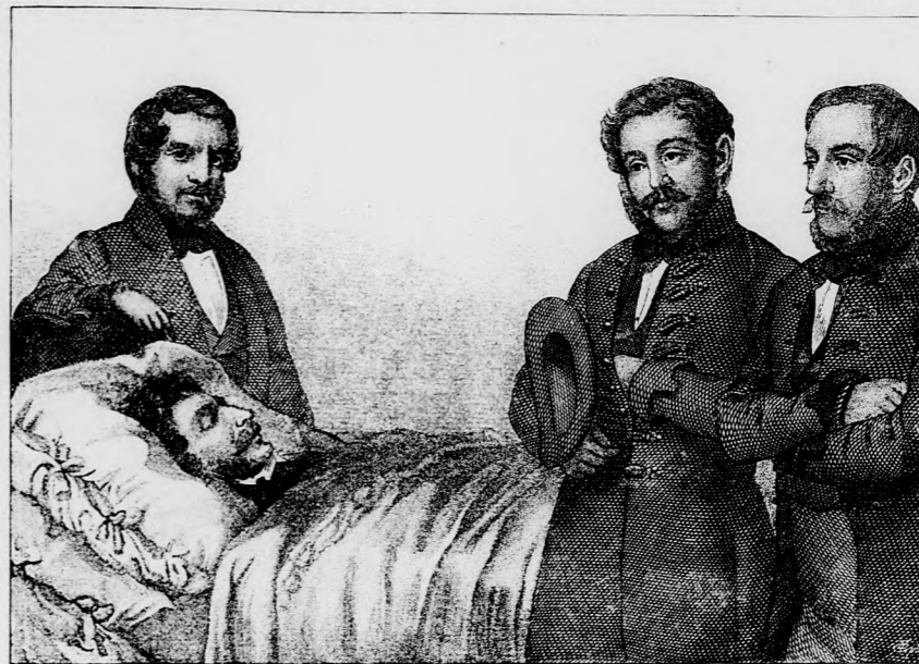
Bajza Toldy Ferenc Vörösmarty

Elhúnyt visszajöhetlenül, Bár érette egész nemzet epedne is!