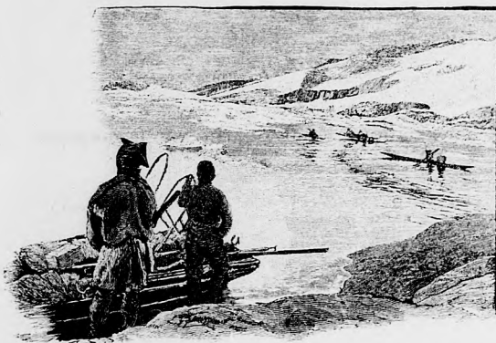
ELTÜNTEK APRÓ CSOLNAKJAIKKAL.

Julius hó 18-án annyira jutott már a hajó a grönlandi partokhoz, hogy Nansen elhatározta, miszerint búcsút mond társaival együtt a hajónak