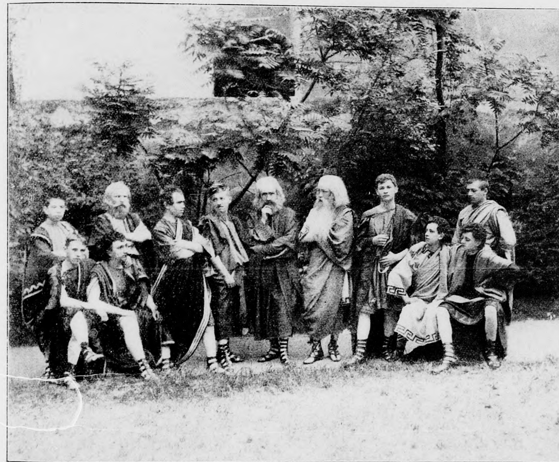
A LÁSZLÓ-INTÉZET NÖVENDÉKEI ARISTOPHANES «FELHŐ» BEN.

Az irodalomtörténet Kerényit ahhoz a körhöz sorolja, a mely a kiváló kritikus és lyrai költő, Bajza József körül csoportosult. És csakugyan, Bajza hatása Kerényim félreismerhetetlen. Az az