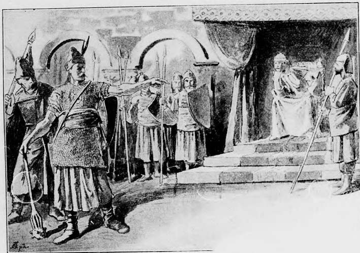
ENNYIT MORGOTT A HERCEGNEK: TE LÁSD A VÉGÉT.

No hiszen a herceg nem is egyszer, hanem