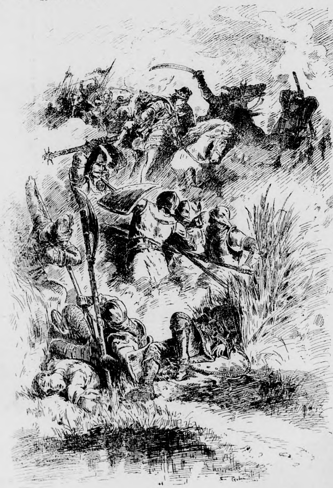
AZ ALPÁRI HARCZ.

Hadúr segítette magyar vitéz kardját dicső győzelemre.