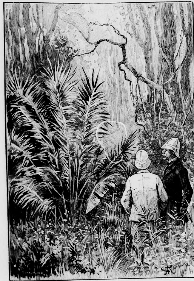
GYÖNYÖRKÖDVE NÉZTÉK A PÁLMA IGETEKET.

— Ha ugyan az igazi Orinoco forrása volt