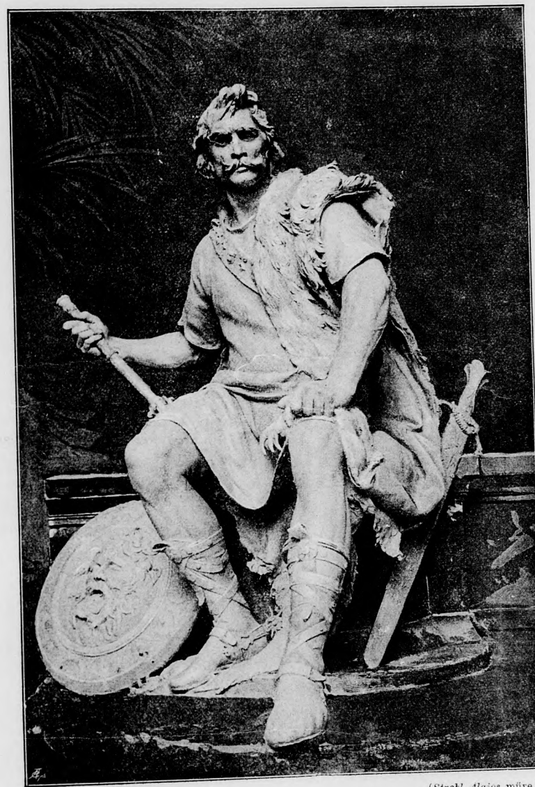
(Strobl Alajos műve.)

Bátyja pedig a királyhoz megy, s farizeus