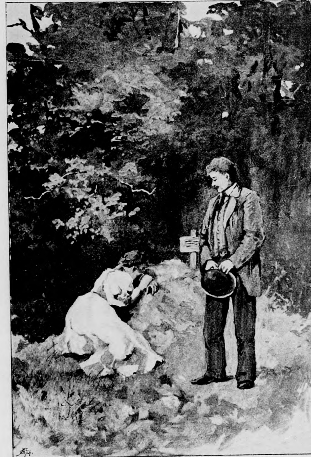
AZ IFJU ORVOS NÉMÁN ÁLLOTT MÖGÖTTE.

— Doktor úr, — nyögte kinosan a haldokló — mentse meg a leányomat! . . . A Szükségtségben, Zilahon van egy bátyám, ahhoz küldje! . . . Kérem, . . .