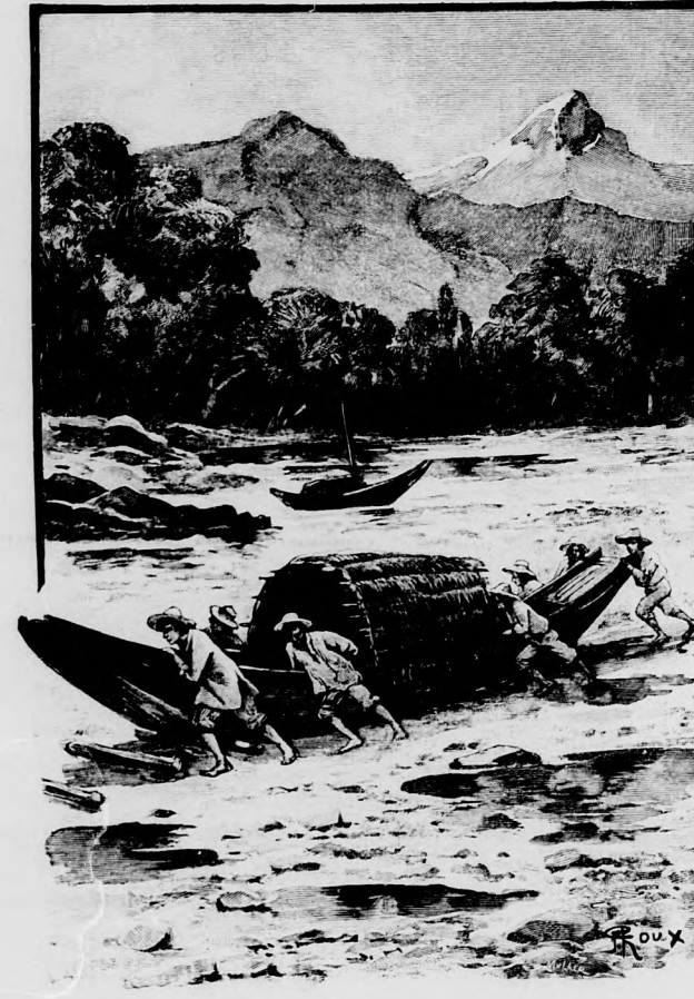
NAGY ÜGYGYEL-BAJVAL KELLETT LEJEBB SZÁLLÍTANIOK.