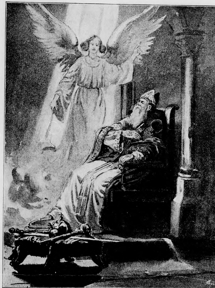
HÓFEHÉR RUHÁBAN ANGYAL SZÁLLOTT LE . . .

Sátrak kiürültek, szállások piacznán gyűltek a magyarok, fejedelmi apostolt hallgatták számosan. Fogadták gyanuval eleinte a szót, de azután fölengedett soknak szíven a jég-kéreg, mert dicséretes volt István szava, tette.