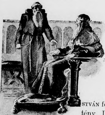
A SZENT KORONA LEGENDÁJA.