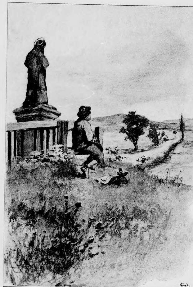
OLYAN SZOMORÚ VOLT KÖRÜLÖTTEM MINDEN...