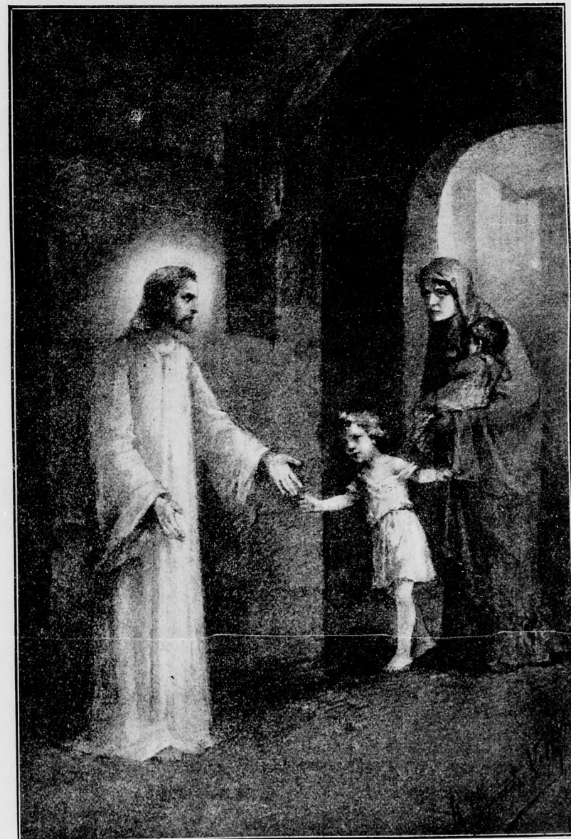
«ENGEDJÉTEK HOZZÁM JÖNNI A KISDEDEKET!»

Ez a békesség az emberi törekvéseknek az egyetlen ezélja; ebben összpontosul minden, a mi jó és értékes a földi életben. E mellett hiú és értéktelen minden,