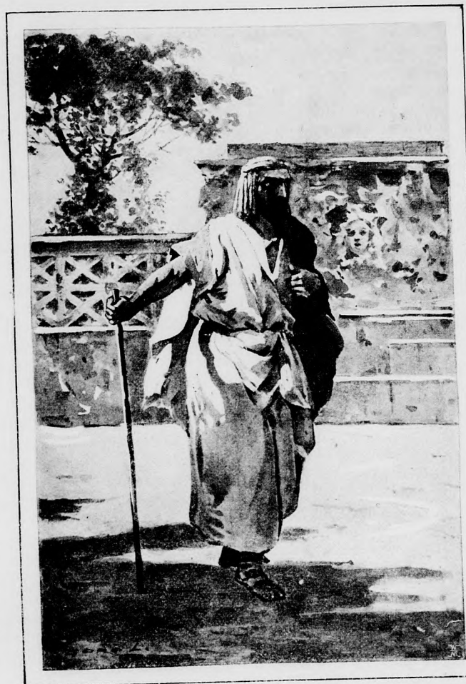
ARBACES, AZ EGYIPTOMI.

«Glaukus kérdezi, beteg-e Jone? A rabnők azt mondják, hogy nem beteg — s ez megnyugtat. Megsértette-e Glaukus Jonét? Ötödik napja, hogy száműztél közeledből. Aggódó szívem azt kérdezi, hogy nem bántottalak-e meg akaratlanul egyetlen szavammal? . . . Én nem tudom, csak érzem, hogy halálosan szomorú vagyok . . . A hízogókkal egy sorba állítottál, mert azok előtt is elzár-