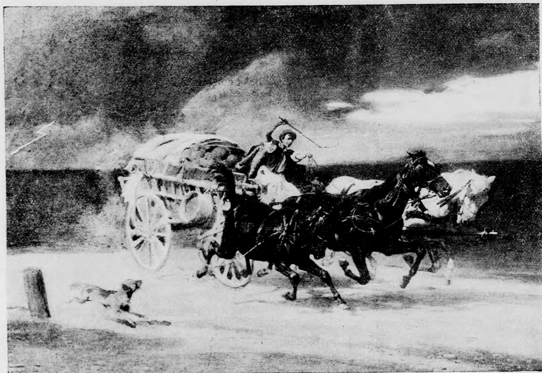
VIHAR ELŐTT. — Wagner Sándor festménye.

Az útszélén álló bokrok ággombolyagján átlát-batok jól. Itt fészkelte hát a kis ökörsem, meg a csalogány? Milyen csúnya hely ez most. A zuzmarás ágak össze-vissza fonódnak egymásba. Hol itt a fészek? Ott lent, a hol legsűrűbb az ág, látszik valami kis feketeség, ott talán a hideg fészek, nyáron meleg otthon. Az út szélén álló fák olyanok, mintha sirórők volnának, szomorú