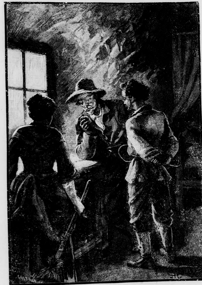
JOBBAN SZEMÜGYRE VETTE A KÜLÖNÖS KAVICSOT.

Három nap alatt elvégezték a munkát Falkenhorstban, s innen tovább vándoroltak Waldegbe. Itt is sok dolguk akadt; ki kellett javítani a kerítésket, melyekkel a kecskék és juhok legelőt kerítették be, s új tetőt kellett csinálni a szénapadlásra is, mert a regit letépte és elvitte az orkán. A háznak magának nem sokat ártott a