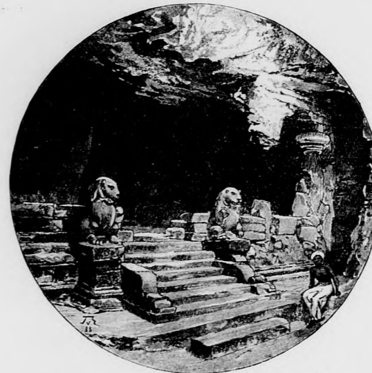
AZ ELEFANTAI TEMPLOM «TIGRISLÉPCSŐJE».

A sok szép, széles utca tisztán volt tartva s