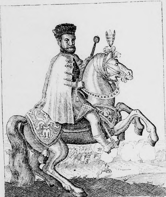
STEPHANUS BOCSKAY DE KYSMARIA COMES COMITATUS BIRARIENSIS

megannyi gócpontja volt, nem lett volna oly szívós kitartásunk a nemzeti eszméért folytatott évszázados küzdelmeinkben, nemesebb ideálként való lelkesedés nélkül az ezek élén álló fejedelmek sem lettek volna igazi hősök, vezéreink, a kiknek egyetlen szavára ezren mozdulnak meg; mert a kinek a szíve lelkesedésre nem gyullad, erre gyűjtani sem képes, a szív fogékonysága ki-művelésének más eszköze pedig nincs, mint a