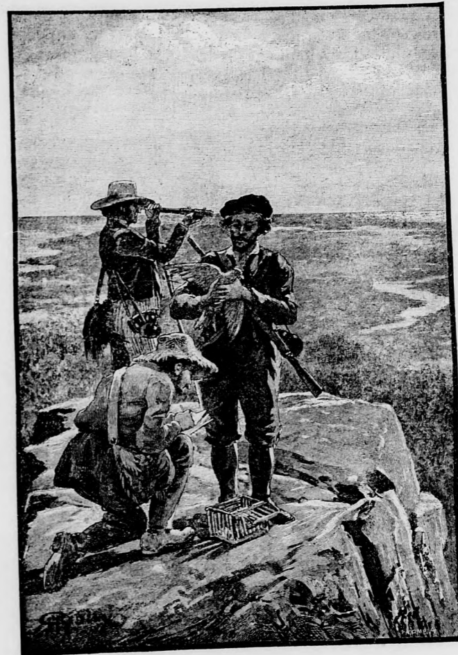
KIVETTÉK A GALAMBOT KALITKÁJÁBÓL . . .

— Ah, nem oda kell nézni, Wolston úr! . . . hanem arra ni! . . .