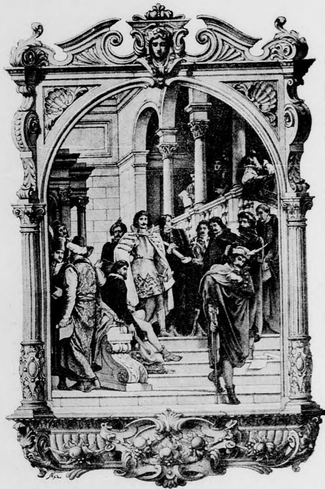
BETHLEN GÁBOR UDVARA. — Lotz Karoly festménye.

A kassai muzeumban őriznek egy olajfestményt, mely Boeckayt ábrázolja, s a melyet valószínűleg a város hajdan való kommenziós piktora festett a város urai rendeletére. Bethlenről kilencz különböző rézmetszésű arczkép ismeretes,