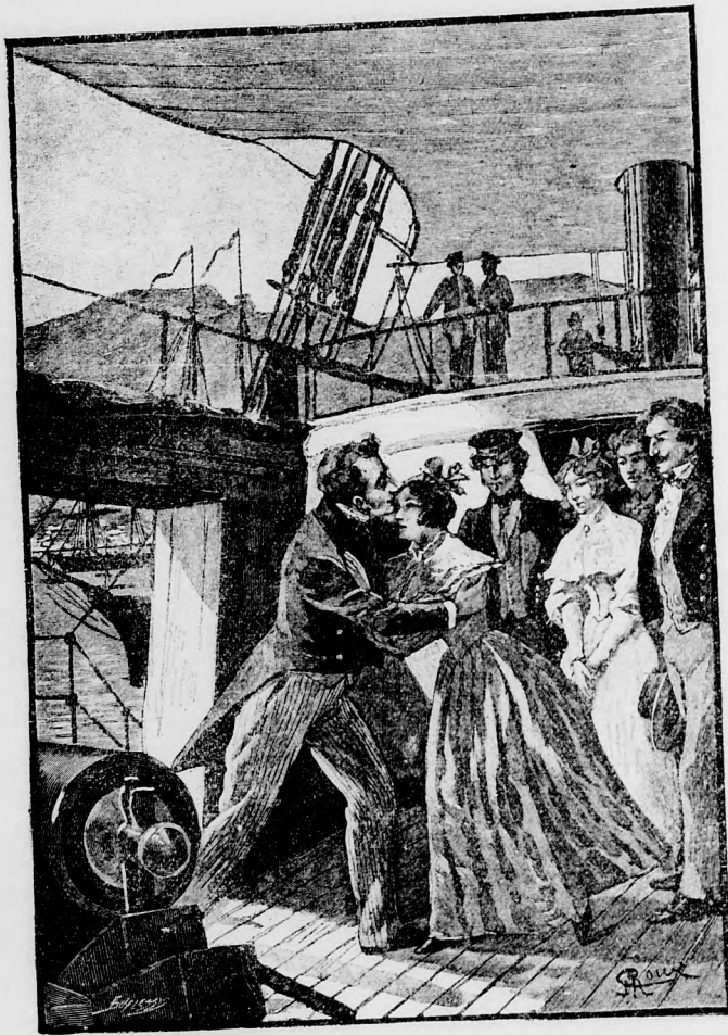
CSAK EGYIK HUGÁT TALÁLTA A FÖDÉLZETEN.

A « Licorne » december 27-dikén szedte föl horgonyait és változó szerenésével vitorlázott Anglia felé. Egymás után hagyta el Szent Ilona,