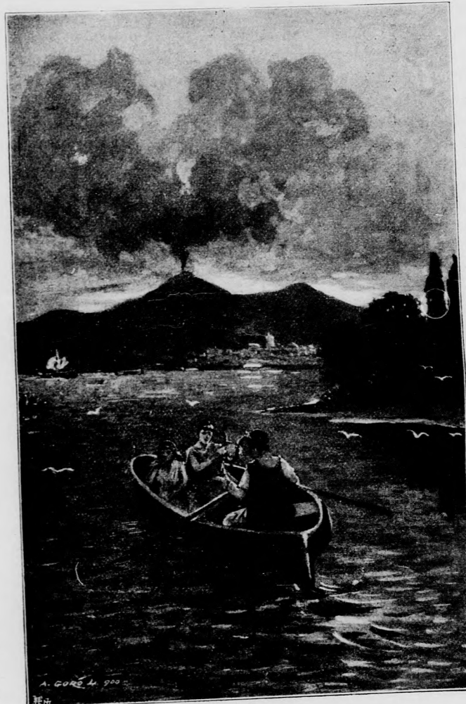
AZ ÓRIÁS A VEZUV ORMÁN ÜL.

A képzelő erő a kereszténység első követőinél épen olyan erős volt, mint a gyermekeknél akár ma is, ámde a pogányok nem egy könnyen tudtak a Megváltó nagy eszméiért lelkesedni. Hogy is foghatták volna fel, hogy egy ember feláldozza magát az egész emberiségért. De viszont természetesnek találták azt, hogy az Üdvözítő emberi alakot ölt fel, úgy szenved, mint az ember, jót tesz másokkal . . . Herakles hőstetteinek a for-