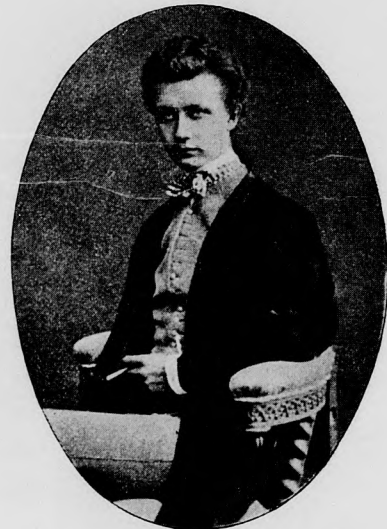
ZICHY GÉZA IFJUKORI ARCÉKÉPE.

csak akkor, ha minden kottán az egész értékeig rajta akarom tartani az ujjamat. Az, a ki félkézzel játszik, nem tartja rajta minden hangon annak teljes értékéig az ujját, hanem csak megüti a fontos hangokat (különösen a basszusban), hogy a fülnék feltűnjenek s maguktól való továbbhangzásuk által váljanak az egész összhangnak részévé vagy alapjává. De ez az eljárás nem oly egyszerű, mint a hogy azt mi most elmondottuk; mert az illetőnek, a ki ilyen módon akar előadni egy darabot, tudnia kell mindenekelőtt, hogy melyek azok a leglényegesebb hangok, a melyeknek okvetlenül hangzania kell. Pl. nagyon gyakran megesik, hogy alaphang és basszushang nem ugyanaz, hogy tehát ne hiányozzék semmi a harmoniából, ép oly kiválóan kell hangzani a basszushangnak, mint az alaphangnak. Vagy például a melódiának egy kísérő szólama más értelmet ad, mint egy másik kísérő szólama, ha már most művésziesen s értelmesen akarok játszani, ki kell keresnem a meg-