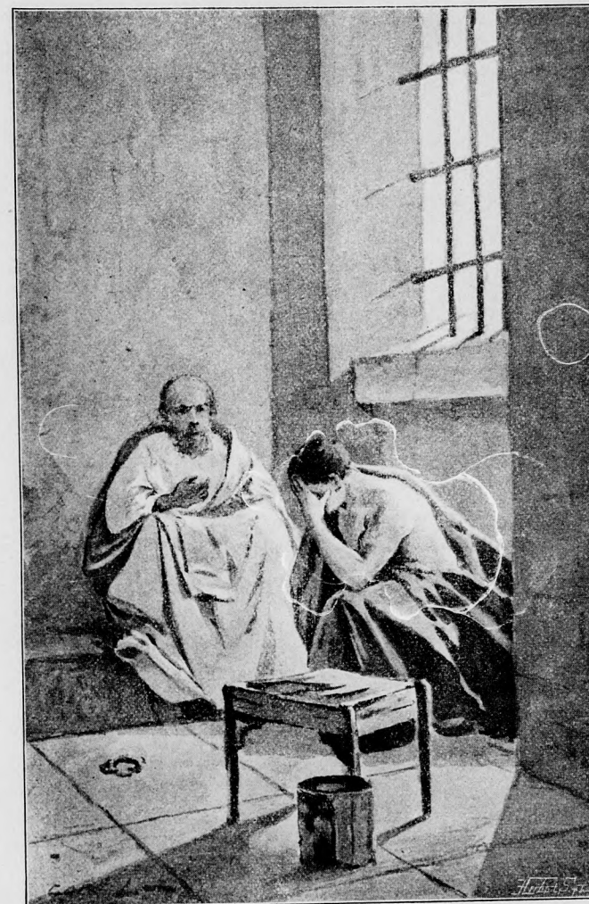
GLAUKUS ÉS OLINTHUS.

tiszta öntudatú volt, de idegei erősen megsínylették, kedélye is komor, hangulata is nyomorult volt. Férfias büszkesége visszatért, a kihallgatások alkalmával visszautasította a nemtelen, hazug vádat, melylyel illették, a halálfélelmet legyőzte. A sötét börtön-czella levegője reánehazódott a tüdejére, a nyomorult sorsnak kinja a lelkére. Ő eddig az életnek csak kényelmét, örömeit ismerte s most minden átmenet nélkül föltárult előtte a szegény és nyomorúság tátongó örvénye.