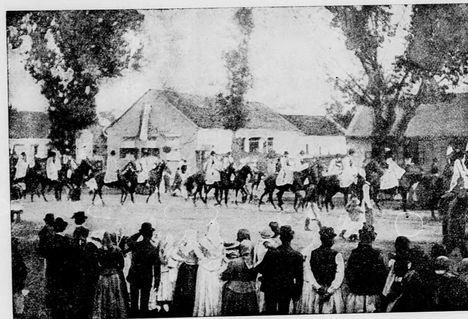
BANDÉRIUM A VENDÉGEK FOGADÁSÁNÁL. — A nagy-szalontai Kossuth-ünnepről.

Éljenzésekkel, vidám kiáltásokkal fogadták. Táncoltak, énekeltek, élesítették a szuronyokat. A gyerekek pedig ezt a kavardást felhasználva