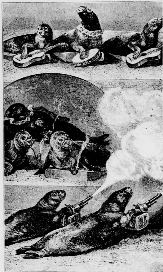
A TUDÓS FÓKÁK.

Ujabb időkben már gólyákat, ludakat, disznókat s fókákat is tanítanak különféle dolgokra. A gólyák igen makacsok s nem kevés bajt okoznak tanítójuknak, a ludak pedig nagyjára igen ostobák, bár meglepően értelmesek is találkoznak közöttük. A disznóról általában azt hiszik, hogy vajmi kevés értelem szorult belé. Pedig épen ellenkezőleg áll a dolog s nem csak okos, hanem leleményes és ravasz is; gyakran szinte hihetetlen