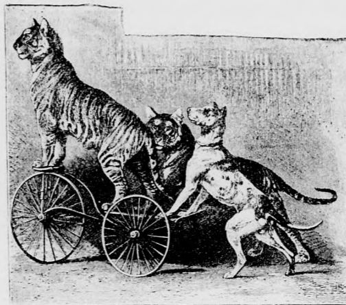
A BICZIKLIZÓ TIGRIS.

Egyébiránt valamennyi vadállat aránylag csak kevés ideig használható mutatványokra: három,