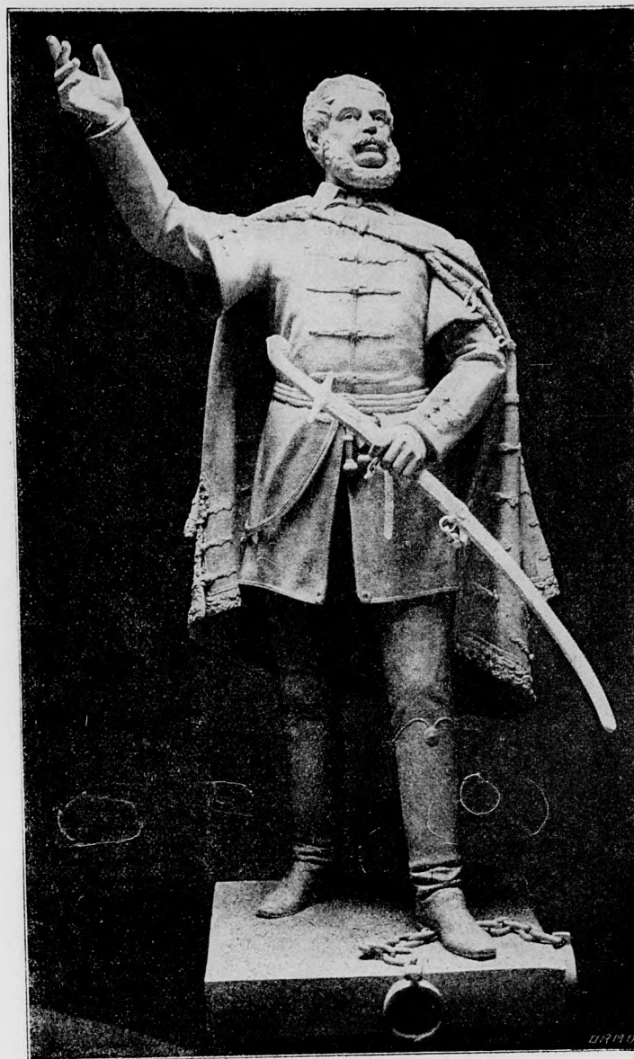
KOSSUTH SZOBRA NAGY-SZALONTÁN.

De mikor magára maradt a szerencsétlen gyermek! Mikor társától a kapuknál elvált, úgy