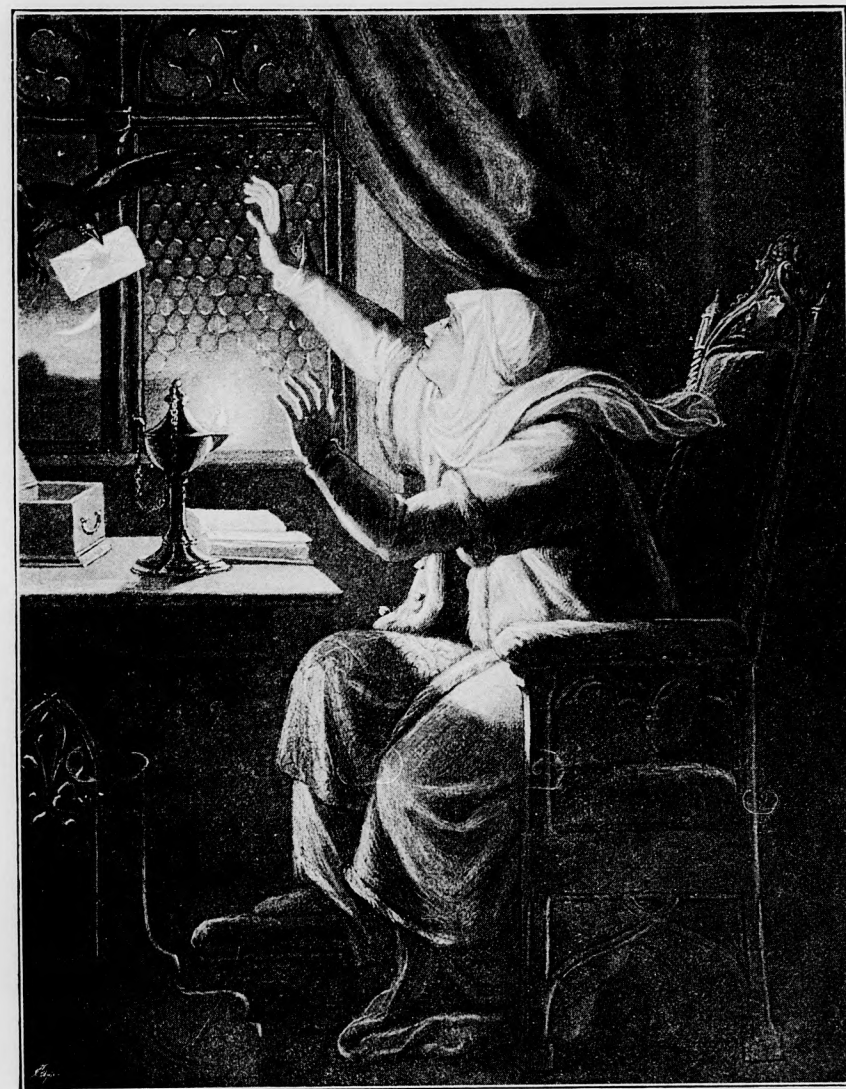
MÁTYÁS ANYJA. — (Lotz Károly festménye.)

Ez szinte ellentétben van azzal a tulajdonsággal, a mely szereti a tiszta, világos rajzot, a melyre bámulatos megfigyelő tehetsége mintegy