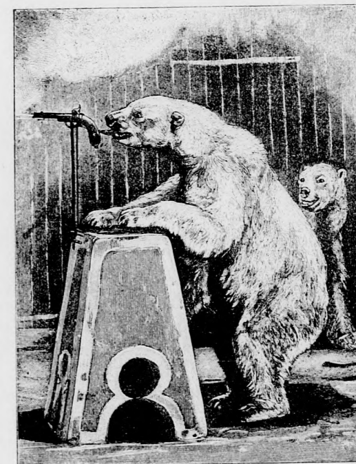
A JEGES-MEDVE PISZTOLYT SÜT EL.

Ezentul mihelyt ismét mutatkozott az erőmű-