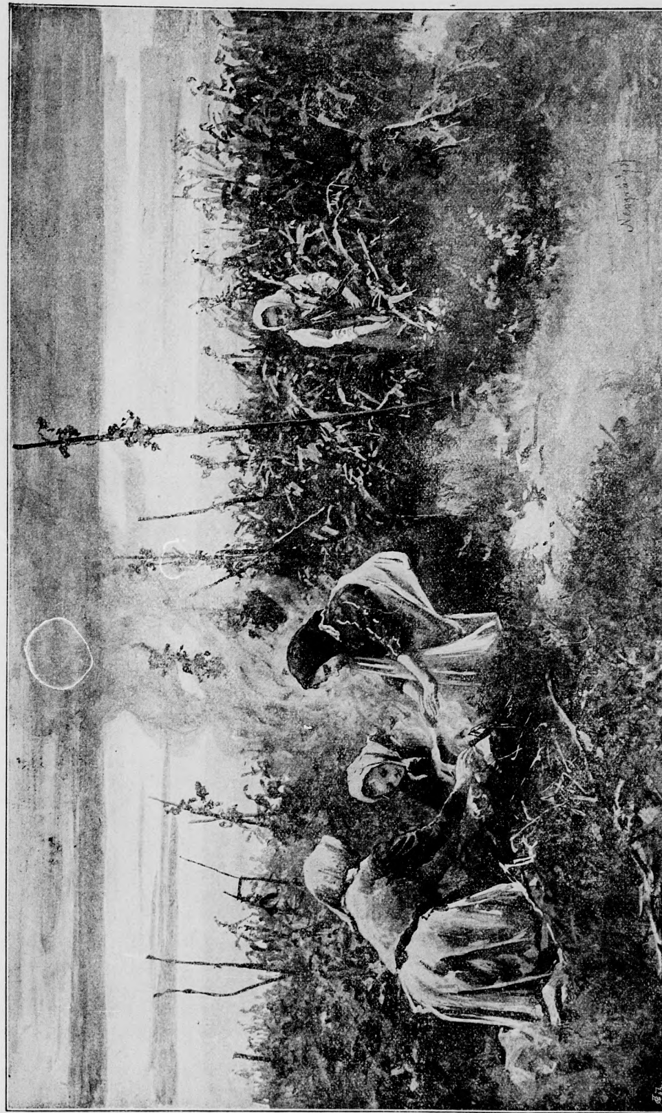
KUKORICZA-TÖRÉS — NEGRÁDY ANTAL RAJZA.

Gaillandre né nagy szenvedélylyel foglalkozott a kertészettel, csak hogy még nagyon is kezdő volt ezen a téren. Folytonosan a legkülönbözőbb növénytan kérdésekkel ostromolt engemet, a melynek még legkezdetlegesebb elemeit sem ismerte. A mennyire értettem hozzá, természetesen megfeleltem kérdéseire.