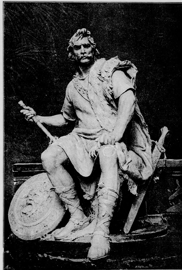
TOLDI MIKLÓS ALAKJA A BUDAPESTI ARANY-SZOBRON.

munkájával. A töredékeket felhasználta, egy-egy versszakot írt hozzá, gondolkozott meséje szövé-sén, de csak 1874-dik évben és a rákövetkező esztendőben végezhette be. De most már teljesen megváltozott terve. Az álharcz, mi az első töredékben könnyen megbocsátható hibának látszott, gyászos tragikum csirája lett, a mely Toldit