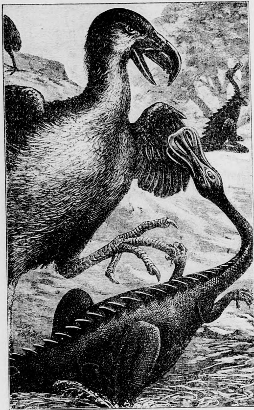
A BRONTORNIS ÉS DINOSAURUS HARCA.

gazdájának pedig épen erre van vágyakozása. Mit tesz hát? Összegyűjti a bojtárokat, előkeríti a tollszedő embert, a kinek legalább is olyan ügyesnek kell lenni a maga szakmájában, mint a juhnyíróknak, azután munkához látnak.