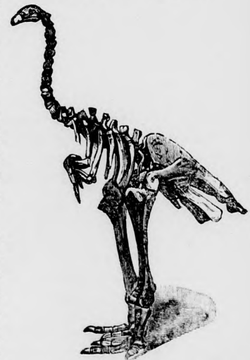
A Dinornis óriás madár csontváza.

Akárhogy megszeli a strucz a ménesben, de annyira még se, hogy fogdosni engedje magát, vagy hogy épen tollait ki hagyja szedni. De erre már nem vehető rá. Félti a maga díszét,