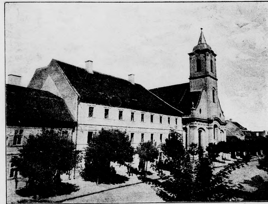
AZ UNITÁRIUSOK RÉGI KOLLÉGIUMA KOLOZSVÁRT.

Igy morogva tovább is, bement apa szobájába, levett egy pisztolyt, lefújta róla a port, miközben