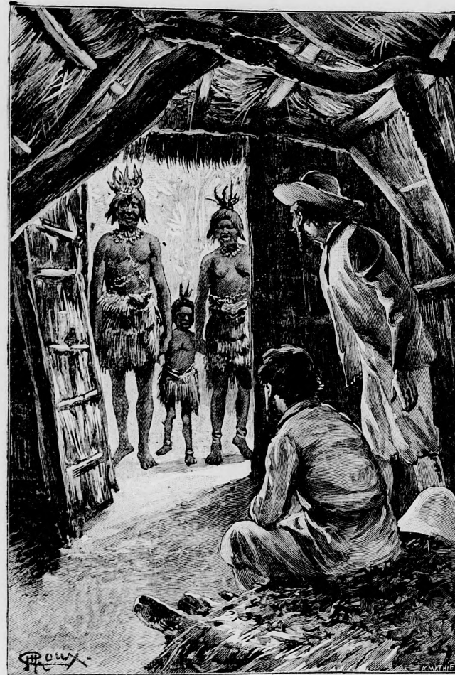
LI-MAI BELÉPETT A KUNYHÓBA.

Szabadok voltak tehát! s kedvükre vizsgálhatták a Vagdi-népet, mely élénken sürgött-forgott az utcákon, s végezte «napi teendőit.»