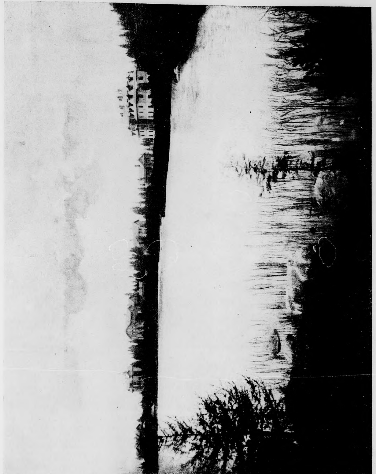
A CSORBAI TÓ.

De hogy egyeztethető meg ez azzal a koromsötétséggel, mely a mélytengerben uralkodik?