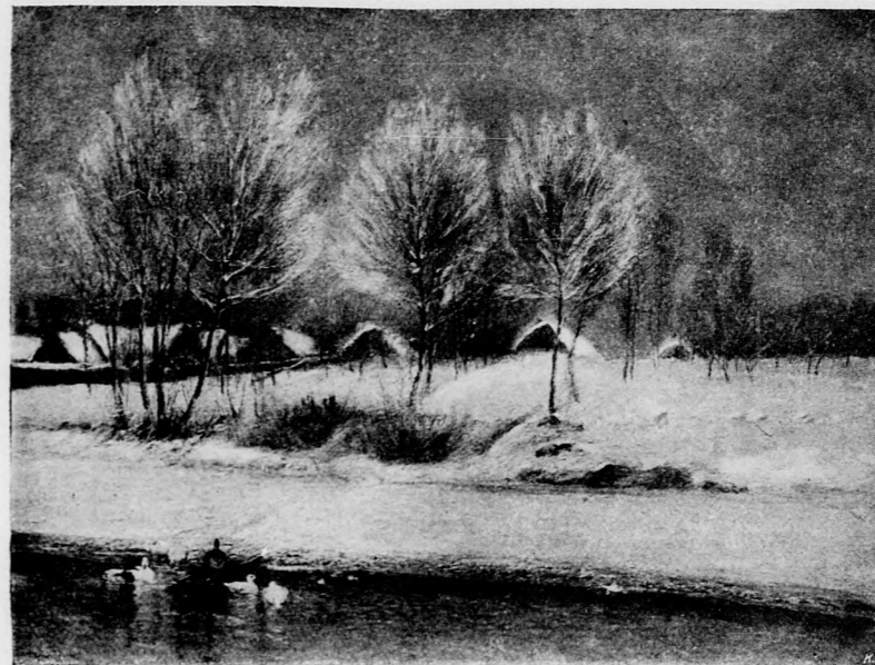
UJVÁRY IGNÁCZ: Tájvázlat a Duna mellől.

A szélesönd a beszélgetés után még pár napig tartott, s az idő csak május 5-ikén fordult jobbra.