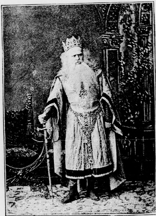
ROSSI, MINT LEAR.

Képzeld el állásait, helyzetét. Ha ezt teszi, a sokkal természetesebben fog beszélni. De mi és a németek fordítva járunk el. Szavalunk mielőtt