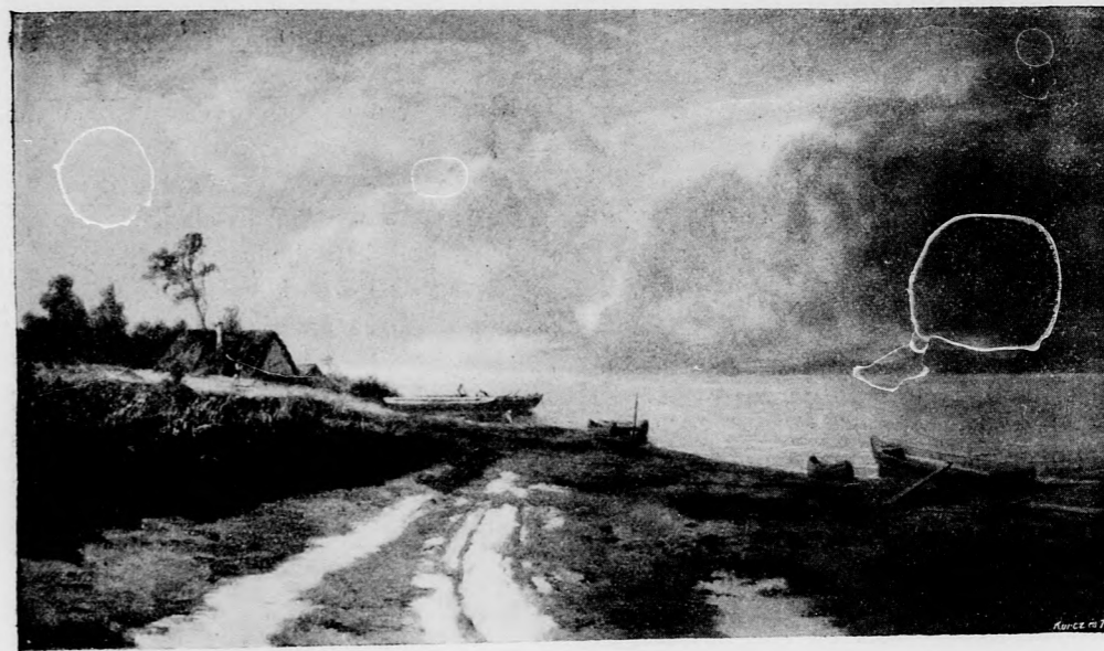
TELEPY KÁROLY: A Balaton a fonyódi partról.

— Oldjuk meg rövidesen a gordiusi esomót, mint Sándor — kiáltá Quintus gúnyosan. Ezt mondván, egyet rugott az üstön, az felfordult, s a forró víz végig ömlött a földön.