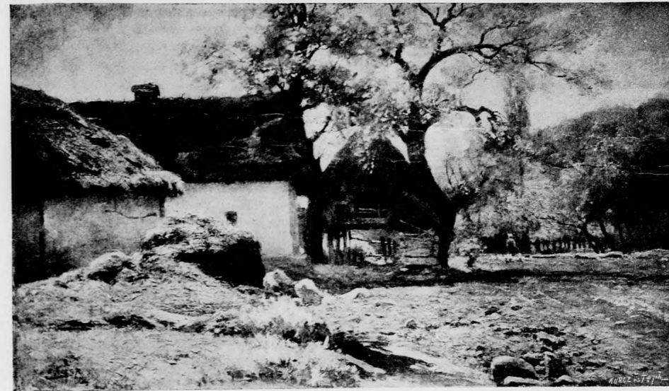
EDVI ILLÉS ALADÁR: Novemberben.

Mikes-ünnepélyt tartott a sepsi-szent-györgyi ev. ref. Székely Mikó-kollégium tanári kara és ifjúsága május 4-dikén d. u. az iskola dísztermében. Az ünne-