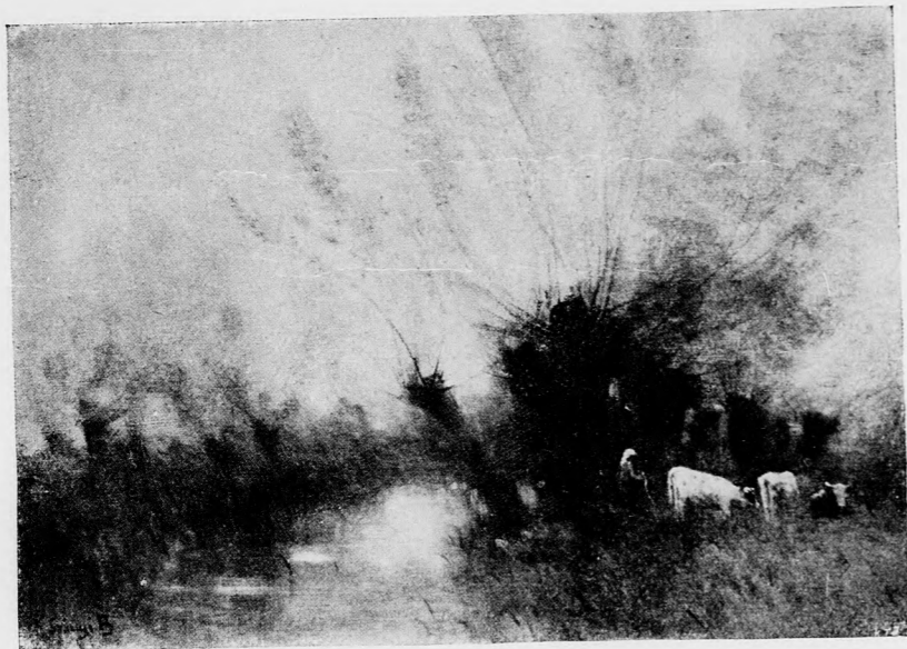
SPÁNYI BÉLA: Est.

A mind sötétebbé váló égen egy fényes tűzszem ragyog a napszálltának helye fölött — az est-