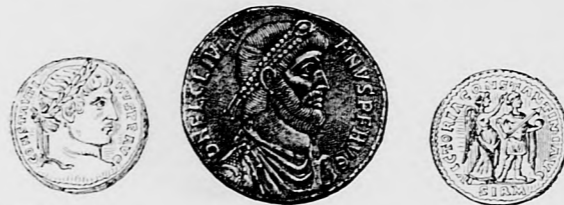
Nagy Constantinus aranypénze.

Hypatia az első pillanatban azt gondolta, hogy nem tartja meg az előadását, majd Orestesért akart küldeni, majd meg tanítványait akarta felszólítani, hogy védelmezzék meg a Múzeumot a barbárok betörése ellen, de a büszkeség s az okosság jobb tanácsot adott neki. Elhatározta, hogy nem hátrál meg; történjék bármi, megtartja az előadást s ha kell, a megalázást és szégyent is nyugodtan tűri a filozófia szent ügyéért.