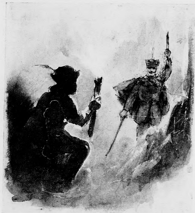
Ő MENT ELŐL, A LEGÉNY KÖVETTE.