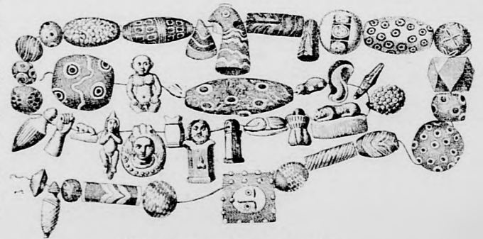
BŰBÁJ ELLEN VÉDŐ NYAKLÁNC.

A ház, amelyben Pelagia és a gótok laktak, a legszebbek egyike volt egész Alexandriában. Az udvaron egymást érték az apró szökőkutak, melyek hűvösen tartották a levegőt a magas kőfa-