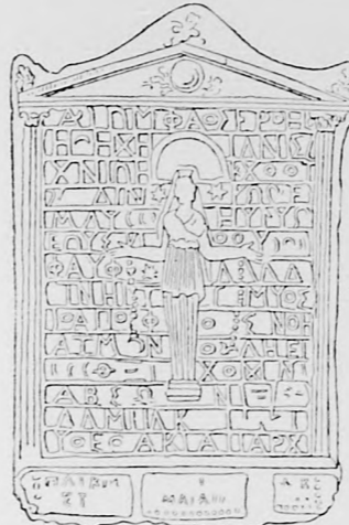
AGÁTKŐ-TALIZMÁN, MELYEL SZELLEMEKET IS IDÉZTEK.

S mivel már nem kerülhetette ki, egyenesen,