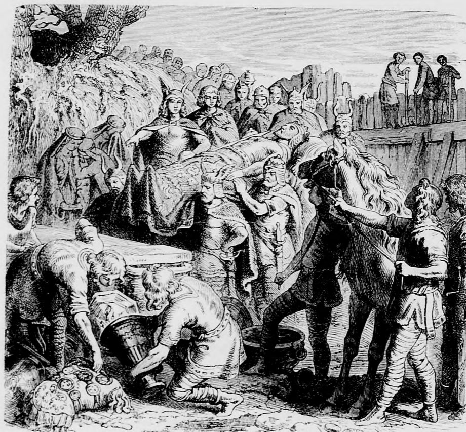
ALARIKOT A BUSENTO MEDRÉBE TEMETIK.