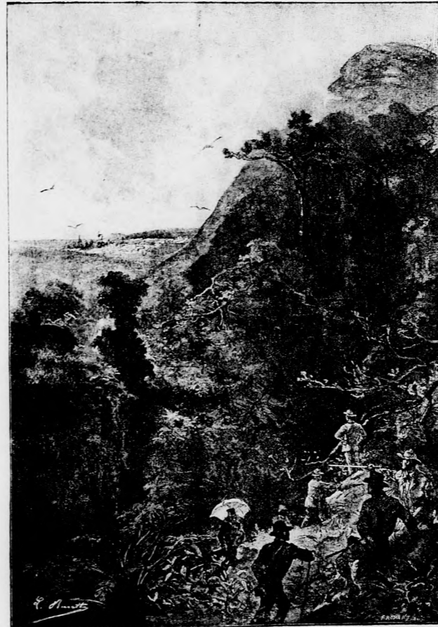
AZ IFJAK MEG AKARTÁK MÁSZNI A HEGYET.

Csak hajnal felé bontották ki újra a vitorlákat, s az első, aki tiz óra tájban a szárazföldet