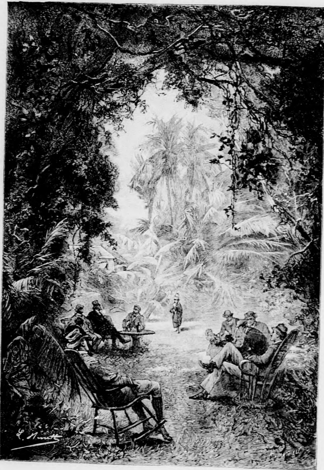
... MIND KIMENTEK A GYÖNYÖRŰ KERTBE.

— Ez a Bob a középső árbóc vitorlarudjáról esett le s estében neki vágódott a darúnak; valószínűleg akkor sebesült meg s ez volt az oka