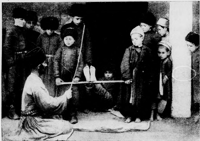
TATÁR ISKOLÁS FIU BÜNTETÉSE.

Leültem egy szép árnyas fa alá. Alig ülök pár percet, jóformán még nyugalomba sem helyezkedtem, jön egy alak oldalról s midőn odaér, udvariasan köszönve, benyúl az övében levő bőrtáskába s kivessz egy — bilétát. Nekem már az egyenruha gyanúsna tűnt fel. Amint a cédulára ránézek, rémülve látom, hogy méltó árképen egy