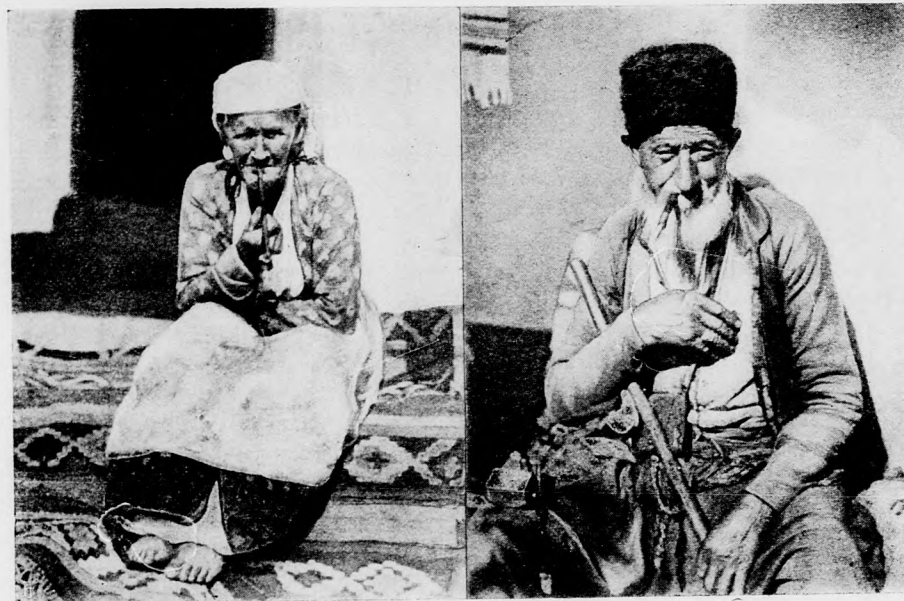
KRIMI TATÁR TIPUSOK.

— Az égiek mindazonáltal szigorúbban ítélnék az eljegyzés szentségének megszegői felett, — jegyzé meg a kincstárnok, — mint te, mert íme Néfert negyedik éve a felesége Ménának s e négy