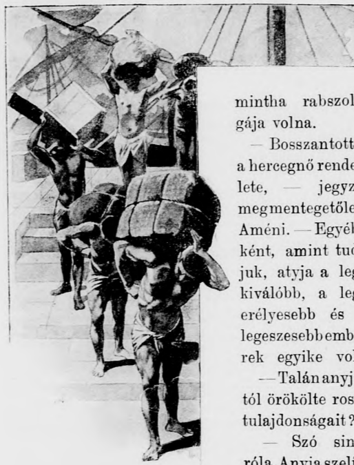
TERHŐK ALATT GÖRNYEVEZŐ RABSZOLGÁK.

— Egy paraszkhita leányhoz, akit a Bent-Anat kocsija legázolt, — felelé Pentaur. — De misoda durva egy ember az úti-marsall! A hangja bántotta a fületem s az orvost úgy fogadta,