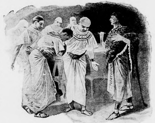
FELÁLLTAK MINDNYÁJAN, HOGY AMÉNIT ÜDVÖZÖLJÉK.

— Pentaur eleitől kezdve becéd volt neked, — vágott közbe a főhoroszkóp. — Mással szemben