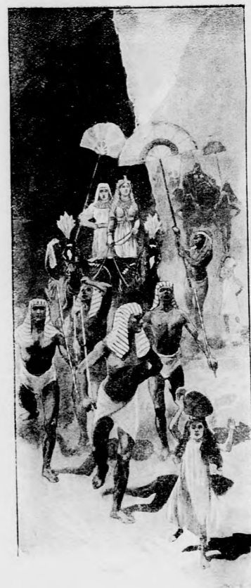
FÉNYES KISÉRET JÖTT.