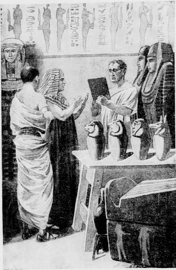
ÉLÉNKEN TÁRGYALTAK A HIVATALNOKKAL.

A balzsamozók házái a kopár hegy aljában állottak, délre a Szeti-háztól. Nilusi sártéglákból készült fal övezte az egész telepet.