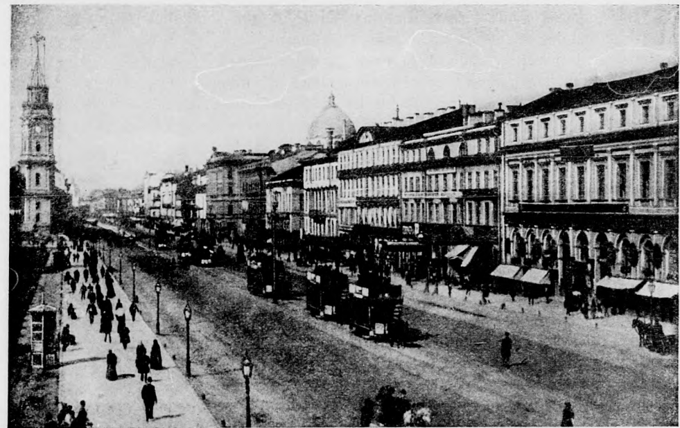
A NEVSKIJ PROSPECTUS MA.

gényét, Hugó Viktor első vadromantikus történeteit és Sue Jenő hátborzongató párisi titkait. Az élénk képzeletű gyermeknek egyéb táplálék sem kellett. Úgy beleélte magát e borzalmas kalandokba, annyira megfogta lelkét ezek érdekfeszítő volta, hogy varázsos hatásuk alól sosem tudott többé menekülni. A váratlan fordulatok kellemes meglepetését később is fontosnak tartotta, s e gyönyörűségben olvasóit is részesíteni akarta. Első műveiben a képzeletének e zabolátlansága, a szörnű helyzetek és meglepő kibonyolódás csattanós hatásai szinte tobzódnak.