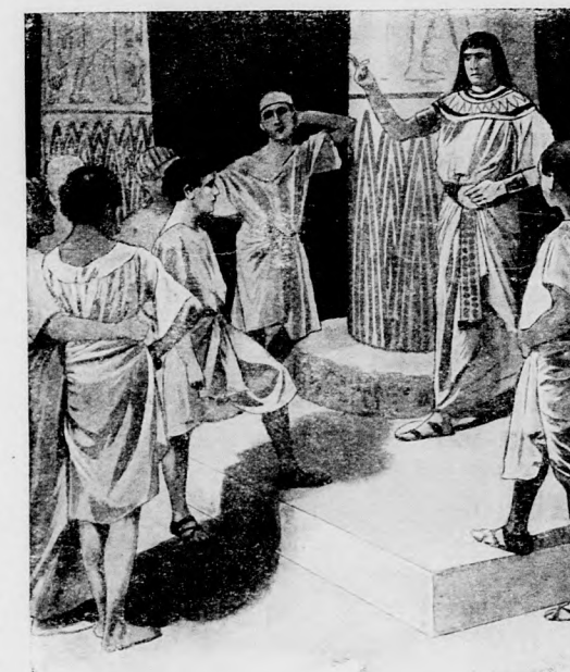
ATYAI JÓSÁGGAL SZÓLOTT HOZZÁJUK.

Naplenyugta előtt elhagyta az iskolát. Améni megáldotta őt s azt mondotta, hogy ha majd