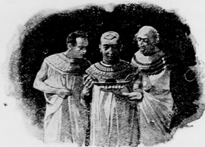
«EZ EGY KOSNAK A SZÍVE!»

Pinem, az öreg paraszkhita együtt siratta a többivel a szent állatok halálát, azután a boncoló-házba ment, leült a padlóra s elővette tarisznyájából az ennyalót, mert már ebéd ideje volt. Amint falatozott, eszébe jutottak a