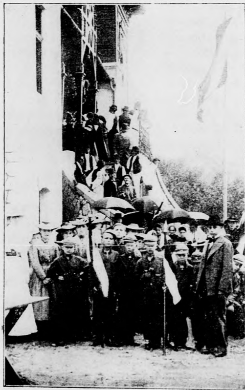
A ZEBEGÉNYI SZÜNIDEI GYERMEK-TELEPRŐL.

Bethe főcélja az volt, hogy kísérleti úton ki-