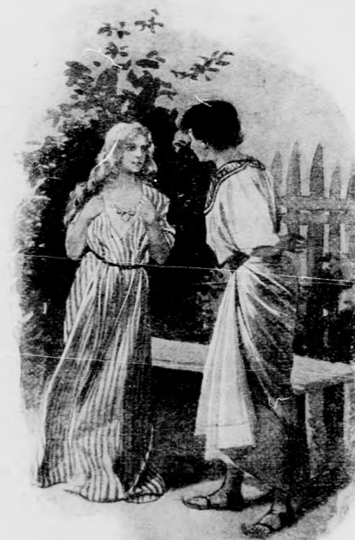
«HISZEN EZEK GYÉMÁNTOK!»