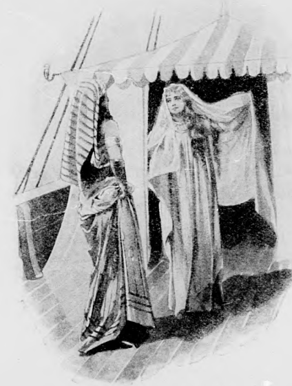
«ÉN VAGYOK UARDA!»

Ani nyájasan búcsúzott el tőlük; a nők hideg udvariassággal viszonzták. Amon-templom papjai élükön az agg főpappal, elkísérték őket a kikötőig. A parton összecsendülő nép áldást kívánt Bent-Anat fejére, de voltak olyanok is, akik gúnyolódtak a távozával.