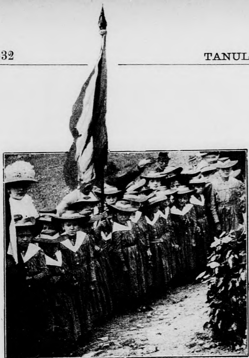
LEÁNYGYERMEKEK A ZEBEGÉNYI SZÜNIDEI GYERMEK-TELEPEN.

A nemeslelkű főhercegi pár korán elhunyt gyermeküknek, László főhercegnek emeltek áldásos emléket e jótékony intézetben.