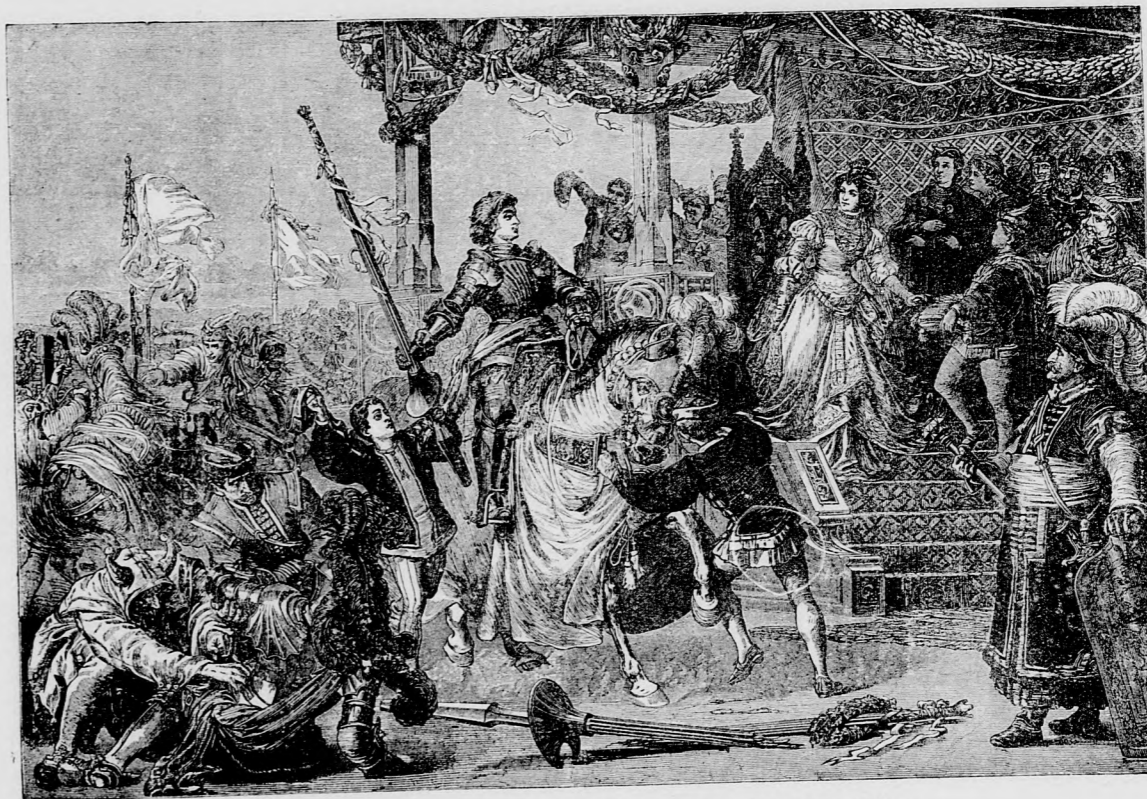
MÁTYÁS KIRÁLY HARCJÁTÉKBAN LEGYŐZI HOLUBÁR CSEH VITÉZT.

Az ipar, gazdaság, föld- és szőlőművelés felvirágozott. Mái is megmutatja a gömői földműves azt a hegyet, melyen Mátyás saját kezeivel kapálta a paraszt ember szőlőjét s nevette a vele sorban izzadó főurakat, kiknek némelyike kidült a nem szokott munkából. Mindennemű kézművesek özönlöttek az országba s Mátyás