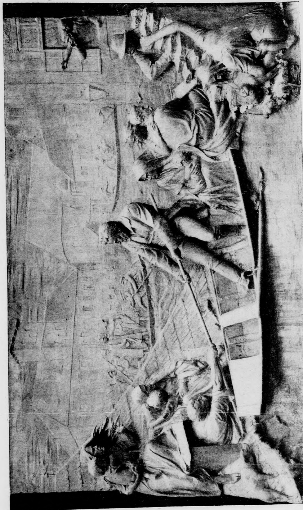
A WESSELÉNYI-EMLEKTÁBLA. — HOLLÓ BARNABÁS SZOBORMŰVE.

A ferenciek Kossuth Lajos utcai templomának falába az 1838-ik évi nagy árvíz emlékére gyönyörű domborművet illesztettek be, mely Holló Barnabás -nak, a jeles szobrásznak a műve. A domborművön egyszerű jelenet közepén emel-