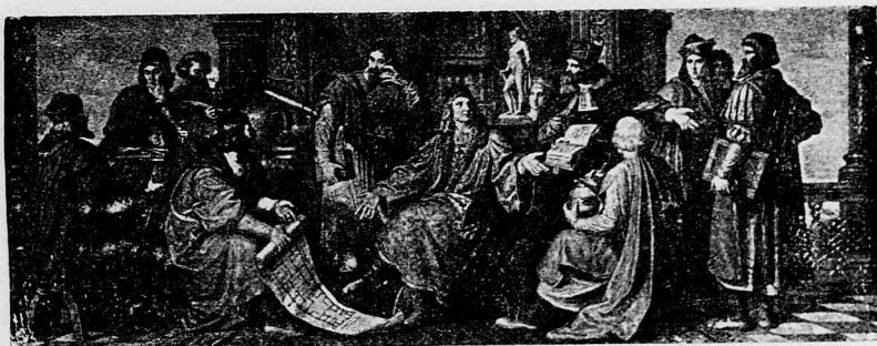
MÁTÁS TUDÓSAI KÖRÉBEN.

ezer aranyat adott ki a király. Minden kötet diszes nyomás, vagy iratban, festvényekkel, aranynyomatú bőrből kötve ezüst és arany kapoccsal; az állványok cédrusfából, himzett selyem függönyökkel, sorban a termekben, háromszáz antik művészi szobor, az előteremben astronomiai és erömütáni műszerek, középen óriási éggömb két angyal által emelve. Ilyen volt a budai könyvtár; * Mátvás alapítá a pozsonyi tudományos egyetemet is. A tudományok terén fáradozó férfiakat tudta jutalmazni, egy astronomiai munka írójának nyolcszáz aranyat és kétszáz arany évdíjat adott; itt azután igazán felsőhajthatunk, hogy boldog régi idők! A külföld legtudományosabb férfait iparkodott hónapok megszerzeni. Budán egy roppant épületet emeltetett, melyben negyvenezer tanuló ifjú számára legyen hely, hét nagy hallgató terem-