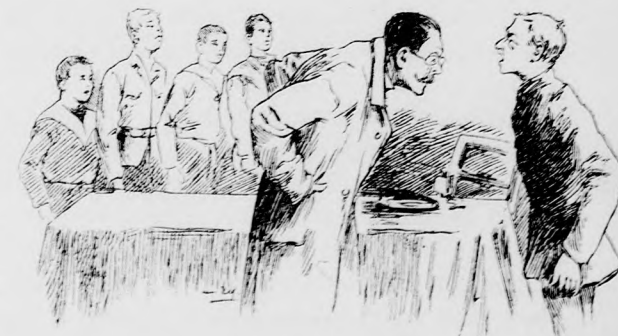
FELELET HELYETT LESZIK KITÉRTETTE A SZÁJÁT.