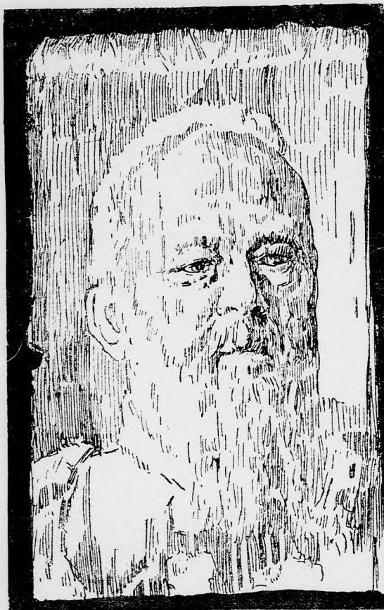
LUITPOLD BAJOR RÉGENSHERCEG.

Ami a készüléket illeti, lényeges részét úgy a feladó, mint az elfogadó állomáson két henger teszi, amelyek egy irányban teljesen egyenlő gyorsasággal forognak. Ezeket a hengereket mindkét állomáson villamos motorok mozgatják, amelyeknek mozgása már magában is megegyező. Ezenkívül azonban egy szabályozó készülék is be van kapcsolva, amely megakadályozza, hogy