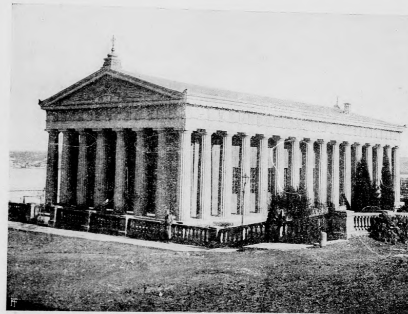
A PÉTER ÉS PÁL TEMPLOM SZEBASZTOPOLBAN.

Aki szereti a fenséges természet nagyszerű pompáját, az megtekintheti azt az európai orosz birodalom legdélibb vidékén, a festői szépségű Krimben és a Kaukázusban. Hogy melyik szebb, melyik vonzóbb, azt bajos eldönteni. A Kaukázus telve van hatalmas költészettel, letűnt nemzetek történelmi emlékeivel, Krimben pedig — Szebasztopol és Baksiszeraij történelmi emlékeit leszámítva, — minden lágy, szelid és családiasan megnyugtató. A Kaukázus természeti szépségei