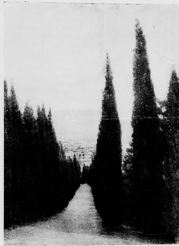
CIPRUS FASOR GURZUFBAN.

voltán, kézzel-lábbal igyekezett magát kimagyarázni, hogy az ő szándéka sokkal tisztességesebb, mintsem, hogy ilyen ódiózus ügybe ártsa magát, de egy pár szónál nem igen tudott tovább jutni. Kövek röpködtek feléje mind a két táborból s a nemes gróf egyszerre csak azt vette észre, hogy lekerül habos lováról s úgy odamártogatják az