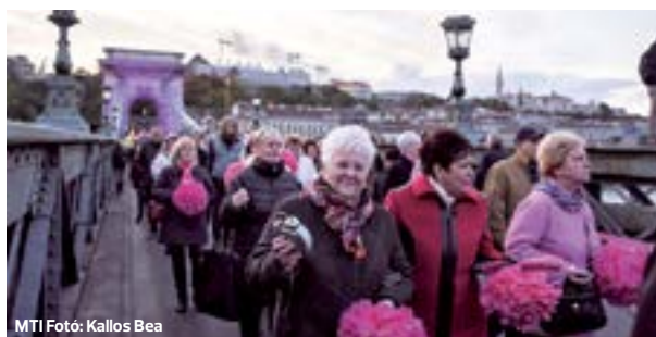
MTI Foto: Kallos Bea