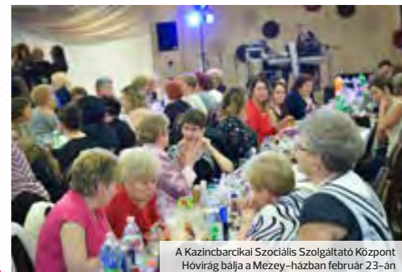
A Kazincbarcikai Szociális Szolgáltató Központ Hóvirág bálja a Mezey-házban február 23-án