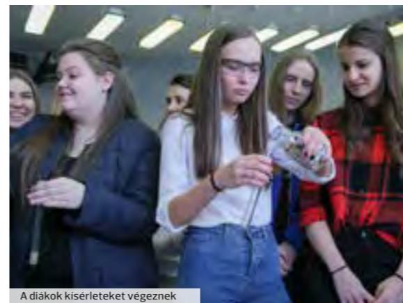
A diákok kísérleteket végeznek

gi-vizsgára való felkészítés, másrészt olyan korszerű gyakorlati laborismeretek átadása, amelyek korszerű, piacképes tudást és gyakorlatot biztosítanak majd a későbbiek során, akár mérnökként, akár középfokú szakképzett-ségű szakemberként. A vegyészeti ismeretek fakultációjának első há-