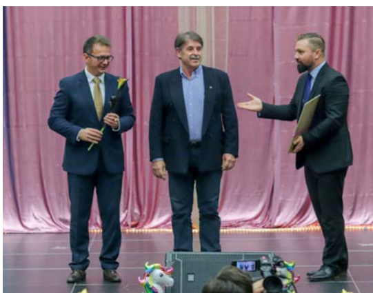
Az „Év Csapata” a VRCK magyar bajnok, kupagyőztes férfi röplabda csapata