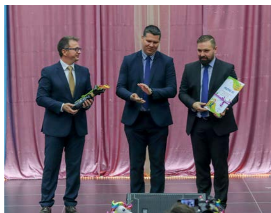
„Mecénás díjban” részesült a Wanhua Borsodchem Zrt. a 2018. évben nyújtott szponzori tevékenységéért.