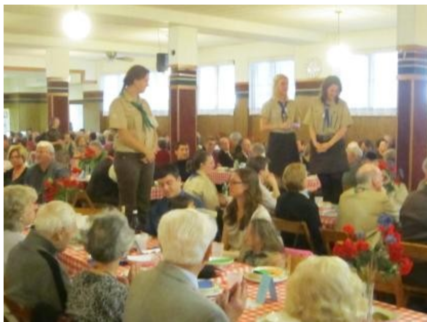
A cserkészleányok éneklik az asztali áldást ebéd előtt