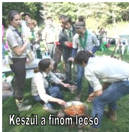
Készül a finom lecsó

térkép szerint a Metropark piknik helyre, ahol további programokat vettek részt, végül a táborúzőn Kos-