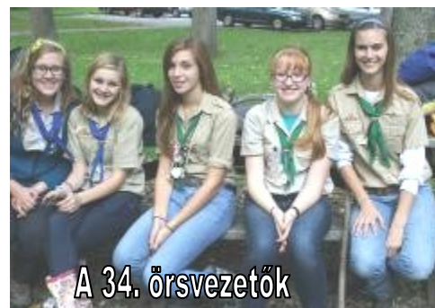
A 34. őrvezetők