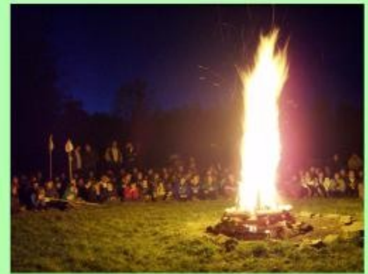
Evening campfires are always a highlight at camp.

The nearly 300 Hungarian scouts in the Cleveland area learn all the traditional skills of scouting but also are familiarized with the history, customs and traditions of Hungary. It is a prerequisite for all members to speak Hungarian. Most also read and write in Hungarian. All meetings (on Friday nights), outings and camps are held with only the Hungarian language spoken. Scouts 14 years old and older can join the Hungarian Scout Folk Ensemble . These scouts meet every Tuesday night and specialize in learning the dances and songs of Hungary among other crafts and skills. To help with language skills, and to learn the geography, ethnography and history of Hungary, the Hungarian School has classes on Monday nights. Most scouts attend classes for up to 10 to 12 years from pre-kindergarten to high school age.