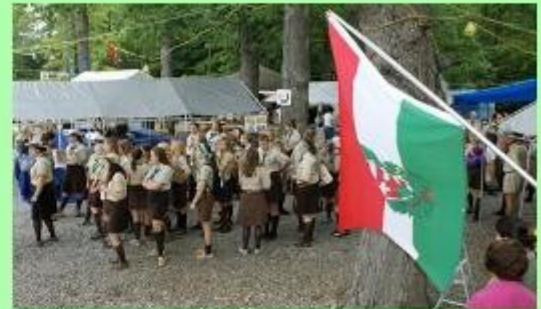
Hungarian scouting is not just about camping.