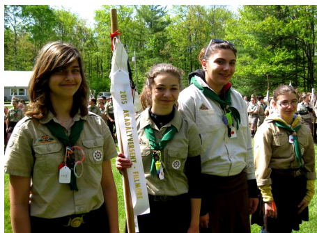
34-es Turul őr, 2. helyezett, Cs. III.