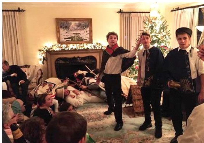
A betlehemezők több családhoz is ellátogattak a városban.