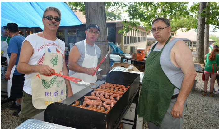
A Lacikonyha a vendégek nagy kedvence.

A fő konyha, a Lacikonyha és a Pesti Kávéház gondoskodott a magyar ízekről. Töltött káposztát, gulyást, paprikás csirkét, lángost, lacipecsenyét és sült kolbászt kóstolhattak az éhes résztvevők. Magyaros desszertként a Dobos és a diós torta, illetve a krémes csábíthatta el a vásárlókat.