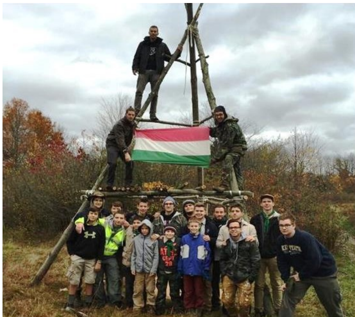
A nyári táborra már készen áll a torony.