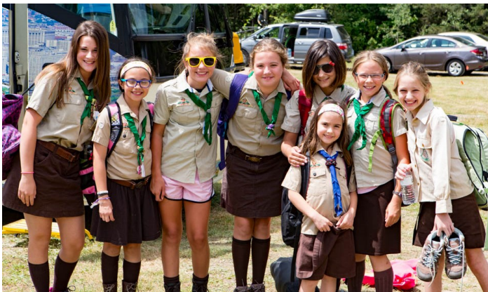
Nagy az öröm! Érkezés a Jubileumi Nagytáborba.

2015. augusztus 6. és 16. között zajlott a Külföldi Magyar Cserkészszövetség (KMCSSZ) öt évente megrendezésre kerülő Jubileumi Nagytábor, a Fillmore, New York-ban található Sík Sándor Cserkészparkban. Több mint 700 magyar cserkész érkezett nagyrészt az Egyesült Államokból és Kanadából, de jöttek Ausztráliából, Ausztriából, Argentínából, Brazíliából, Kínából, Németországból, Svédországból valamint a Kárpát-medencéből: Kárpátaljáról, Erdélyből, Felvidékről, Vajdaságból és persze Magyarországról is.