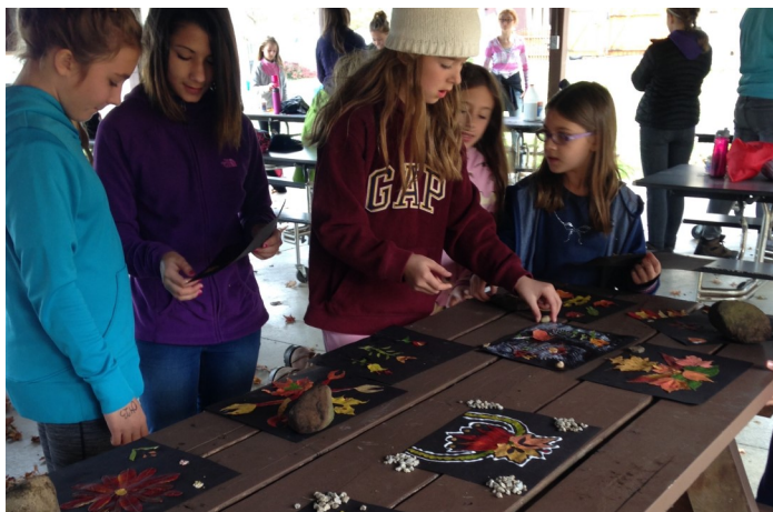
Az őszi kiránduláson kézügyességre is jutott idő.

Október 10-én szombaton a clevelandi kiscserkészek, fiúk és lányok együtt, jó nagyot kirándultak! Negyven kiscserkész vett részt az őszi kiránduláson a Rocky River Mastick Parkban. Meg voltak hívva, hogy segítsenek két öreg néninek megkeresni az elveszett szőlőjüket! Keresés közben találkoztak két hortobágyi csikóssal, egy kézműves nénivel, egy zenésszel, egy tánc mesterrel és egy idős falusi házaspárral. Akadályverseny formában sikeresen vissza szerezték az elveszett szőlőt és szüreti mulatsággal megünnepelték! (Gyermán Mónika öv.)