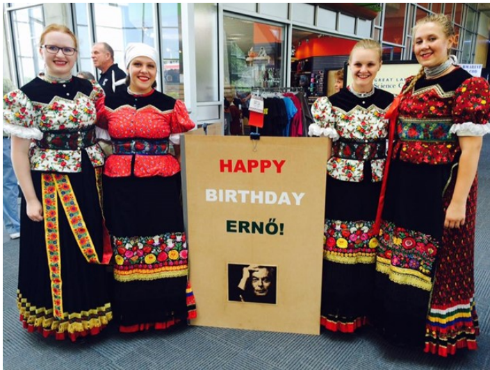
Regös cserkészeink a Rubik kiállításon.