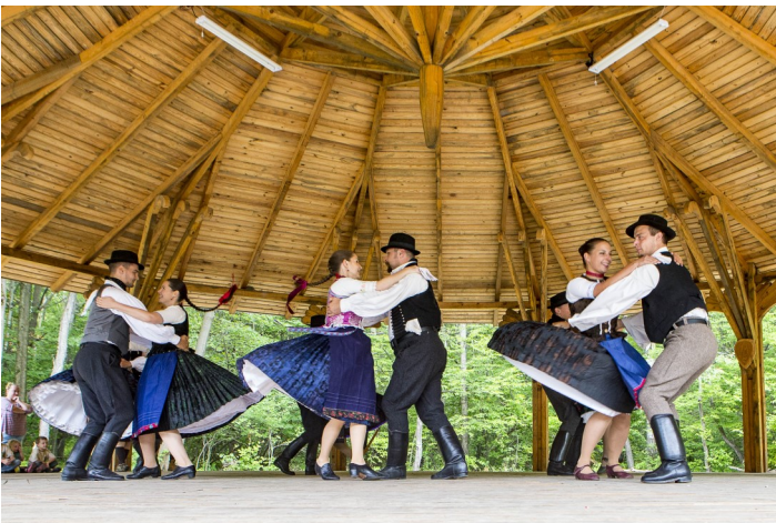
A Nógrád táncegyüttes 13 tagja felelt a hagyományörzés programokért.