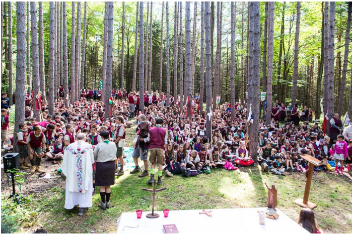
Vasárnapi Szentmise a Fenyőkatedrálisban, Sík Sándor Cserkészpark, Fillmore, New York.

Az eső miatt elmaradt a szombat reggeli számháború, de késő délelőttre kisütött a nap, így megtartották a kuruc-labanc csatát a Nagyréten. Szombat délután pedig óriási „lakodalom” volt, 1,000 cserkész és vendég részvételével, élő népzenevel és táncmulatsággal. A cserkészek a tábor folyamán megismerkedtek a hagyományos népi esküvői szokásokkal a Magyarországról meghívott Nógrád Táncegyüttes 13 tagja által.