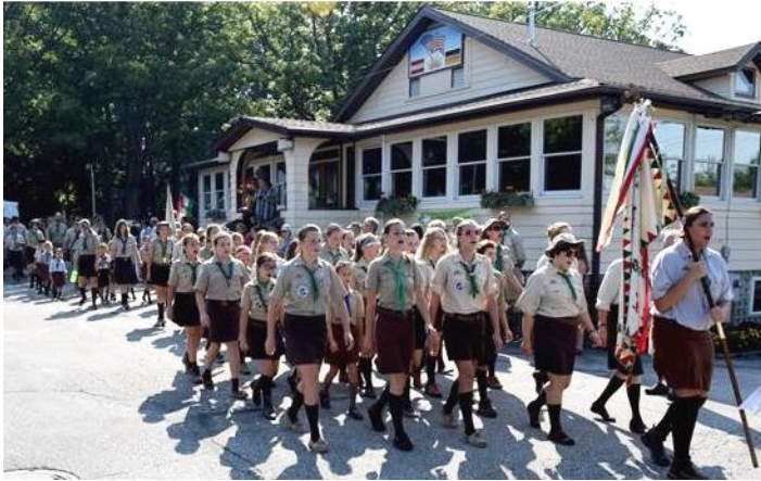
Zászlófelvonásra igyekeznek a lányok.

A clevelandi Cserkész Barátok Köre szeptember 6-án rendezte meg a 60. clevelandi Cserkésznapot szokásos helyszínén, a German Central Park-ban. A jubileumi cserkésznap talán még nagyobb programkínálattal várta látogatóit, mint korábban, s az eseményen Kövér László , Magyarország Országgyűlésének elnöke, is részt vett. A hagyományoknak megfelelően zászlófelvonással kezdődött a 60. cserkésznap is, ahol a helyi cserkészcsapatok mellett a Kárpát-medencéből érkező felvidéki kontingens csapata is felsorakozott. A jubileumi cserkésznap alkalmával kitüntetésben részesültek azok a cserkészek, akik már több évtizede erősítik a clevelandi cserkészteret, illetve volt olyan felnőtt cserkész, aki 60. alkalommal vett részt a cserkésznapon. A zászlófelvonást katolikus és protestáns Istentiszteletek követték.