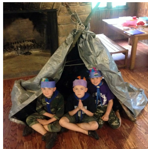
Kiscserkészzeink indián teepee-t építettek.