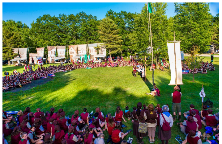
Ünnepélyes zászlófelvonás a Nagyréten, Sík Sándor Cserkészpark, Fillmore, New York.

A tábor nagyrétén megelevenedett a Sárospataki vásártér. Egy színpal sejtelmesen ábrázolta a sárospataki főtér épületeit. A vásártérre varázsoltak mester műhelyeket, üzleteket és hivatalokat, egy kápolnát, a hadnagyok székhelyét, harangot, főkaput, kis kaput és egy szökőkutat. A program magába foglalta a vásártéri hangulatot, amelyben kézműves mesterek bemutatták munkáikat.