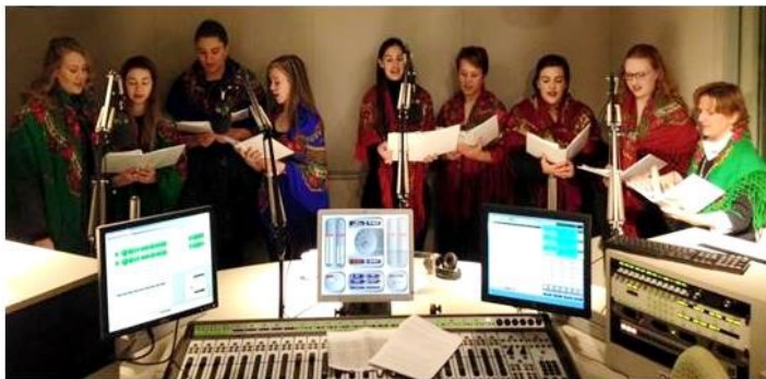
Karácsonyi kántálás a Kapossy Rádió stúdióban.