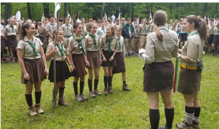
Cs. II., 1. helyezett: 34. sz. Zrínyi Iлона lscs., Nefelejcs őr