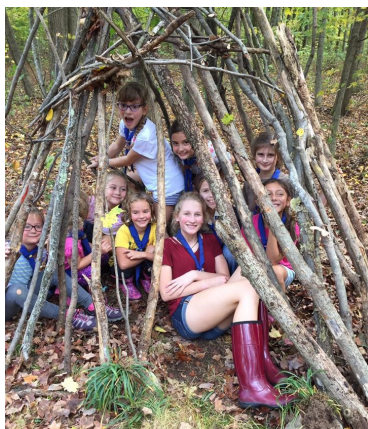
Kuckó építés közben.

...segítőkész! 2017. október 7.-i kirándulásunkon ezt be is bizonyították legkisebb cserkészeink amikor a Hiram, Ohio-i Geauga Magyar Club területén Nimród királynak segítettek Hunort és Magyart megtalálni. A kirándulás folyamán volt kincskeresés, íjazás, tánc, almáspite készítés és kuckó építés. A nagycserkészekkel együtt számháborún vettek részt és Nimród királyhoz hasonlóan íjat is lőttek. Sajnos nem találták meg se Hunort se Magyart, de a kirándulás folyamán a kiscserkészek megmutatták, hogy milyen ügyesek, engedelmesek és segítőkészek. (Balássy Alexandra st.)