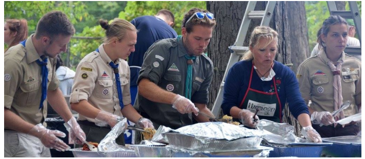
A vendég cserkészek is beálltak segíteni az ételosztással.

A magyar ízeket a Főkonyhán , a Lacikonyhán és a Pesti kávéházban lehetett megkóstolni. Volt ott minden, mi szem szájnak ingere: gulyás leves, pörkölt cipóban, töltött káposzta, paprikás csirke, lacipecsenye és a nagy nyári kedvenc, a lángos. Természetesen nem hiányozhatott az étlapról a palacsinta, a dobostorta, a rétes és a kürtöskalács sem. Hűsítő sör, üdítő és pálinka kíséretében kóstolhattak bele az éhezők.