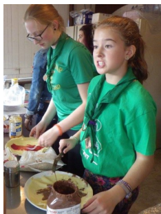
Gyorsan fogyott a palacsinta.