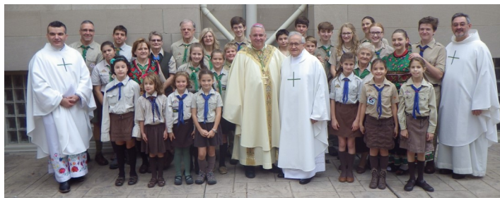
Clevelandi cserkészek az ünnepi Szentmisén.