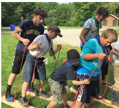
Ügyességi játék a tanyázáson.

A kiscserkészek nyári táborát tanyázásnak nevezzük. A kiscserkészek igénye azt kívánja, hogy mind a portyán, mind a tanyázás során házban aludjanak, ne sátorban — ez különösen igaz az első alkalommal tanyázókra, a legfiatalabbakra. A tanyázás rövidebb, mint egy cserkésztábor. Általában 4-6 éjszaka, és a napirendjük is más: mindenképp igénylik a délutáni pihenőt, és alvási igényük is nagyobb.