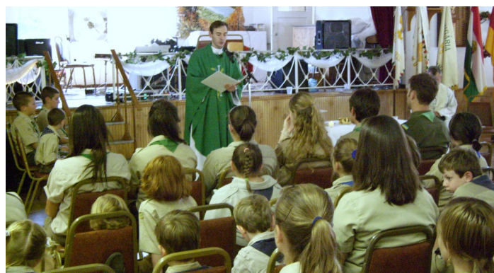
Cserkésznapon szentbeszédet mond a misén 2008-ban.