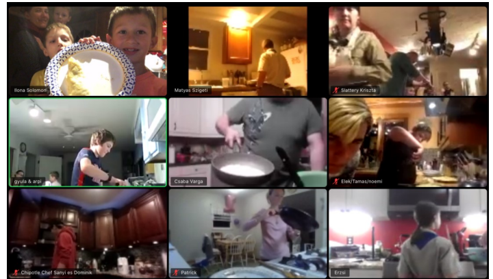
Palacsinta készítés Zoom gyűlésen keresztül.

Sajnos, decembertől a járvány terjedése miatt Zoom gyűlésekre voltak kényszerítve a csapat és őrsi összejövetelek. De a vezetők nagyszerű programokkal szórakoztatják a cserkészeket. — A Szerkesztőség