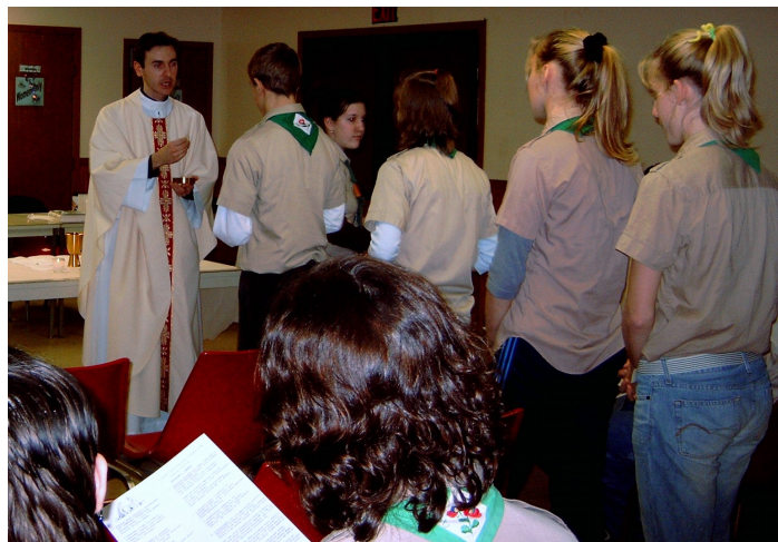
2004-ben új papként áldoztat a clevelandi VK hétvégén tartott misén.