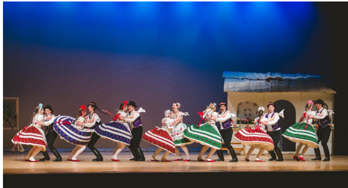
A Regös Csoport gála műsor előadása Lakewood-ban, 2018. nov.-ben.

A csoport életében a körutak mellett a kerek évfordulók megünneplésére rendezett gálaműsorok (ún. nagyszereplések) jelentenek fontos mérföldköveket. Az ötévente zajló, többszáz embert megmozgató eseményből idén november 18-án lesz a