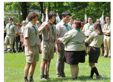
Első díjas 34-es Páva ős és 14-es Sakál ős