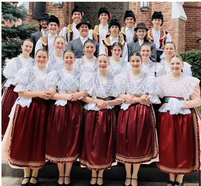
Clevelandi regös cserkészek a Pontozón New Jerseyben, 2023. április.

A regös csoport tagjai az aktív cserkészek köréből kerülnek ki. Tag az lehet, aki legalább 14 éves és folyékonyan beszél, ír és olvas magyarul, valamint aktívan részt vesz csapatainak tevékenységében. A csoport táncol, elkészíti a saját népviseleteit,