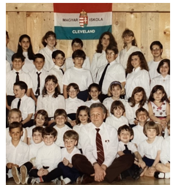
A Magyar Iskola igazgatója, 1992.