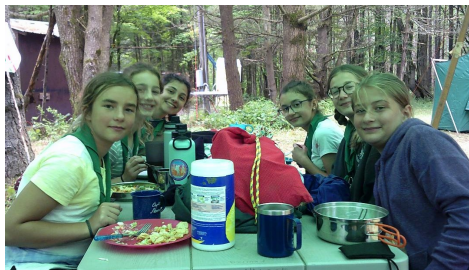
Jókedvű reggeli a csapattáborban.

maradjanak a keretmeséhez – mindenhová masírozva mentek és hadigyakorlatokat végeztek. A saját maguk által épített vadászlesről lőtték a törököket, a táboruk bejáratát jelképező kaput is ők állították össze. A fiúk és a lányok programját összekötötték a közös étkezések, népi játékok, az evezés, a tánc, és a táborúzt különleges hangulatát is együtt élvezhették mindannyian. Különösen emlékezetes marad a számháború, ahol a lányok játszották a törököket, a fiúk pedig a labancokat. A csapattábor a cserkész év koronája, nagyon jó érzés együtt kimenni a természetbe, és a foglalkozásokon, kisebb kirándulásokon elsajátított tudást végre kamatoztathatják végre élesben. Azok a cserkészek, akik rendszeresen járnak csapattáborba, sokkal felkészültebben juthatnak majd el a vezetőképző táborba.