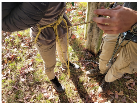
Csomó kötések első próbálkozások.

A cserkész élmények másnap kezdődtek csak igazán. Mint kiderült, minden napnak van egy felelőse, ő az úgynevezett „napos”, és ő felel azért, hogy a kitűzött ütemtervek megfelelően menjenek a dolgok, ő osztja be különböző feladatokra az egyes őröket. Vannak, akik a konyhásoknak segítenek porciózni az ételt, vannak, akik tábortűzhöz gyűjtenek tűzifát, vannak, akik megrakják a máglyát, stb. Én 40 évesen eléggé kilógtam a fiatalok közül, és cserkész sem vagyok, ezért nem mentem a fiatalokkal a vizitúrára, hanem inkább a konyhai feladatokat ellátó támogató személyzethez csatlakoztam, kuktaként.