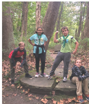
Pihenés a biciklizés alatt.

Van egy nóta, miszerint októbernek, októbernek elsején nem süt a nap Csikkarcfalva mezején. A clevelandi cserkészeknek idén októbernek elsején szépen sütött a nap, mivel a Munkács és Klapka György rajokkal kerékpár kirándulást tartottunk a „Tow path” ösvényen, ami az Erie kanális mellett húzódik. A túra távolsága elég komoly volt, 18 mérföldet tettünk meg a Canal Way Center piknikhelytől (ahol hagyományosan a