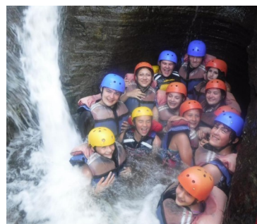
Egy kis lubickolás az evezés közben.

egy közös bankettel zártunk, ahol malacot süttöttünk vacsorára. Csapattáborunk szolgálta a csapatunk szellemének építését, de ugyanakkor közös emlékeket is szereztünk a egymással és nem utolsó sorban a szülők felé is egy jó képet adtunk arról, hogy gyerekeik számára az egyik legjobb program a nyári csapattábor. (Pál Gergely st.)