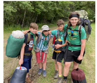
Portyára készül a Gepárd őr.

A két csapat cserkész korú tagjai a nyári csapattáborukat Fillmoreban tartották, június 11 és 18 között. A hét napos tábor nagyon jóra sikeredett, mert a programot a hely adottságaihoz, a cserkészlelményhez és a magyar történelmi és kulturális hagyományokhoz igazítottuk. A közeli Letchworth állami park és Genesee folyó remek lehetőséget adott félnapos kirándulásra, portyára és vadvízi evezésre. A tábor kiemelkedő cserkészprogramjai közt említenénk az őrsi főzést, ijazást, rohampályát, számháborút, csillagászatot és métázást. Mivel a fiú tábor történelmi keretét Kinizsi Pál és a korai török ellenes védelmek adták, több táborúzt is erről szólt, de más tábori programban is alkalmaztuk a keretmest, pl. az éjjeli „török riadó”. Kihaszználva, hogy a lányok is a Sík Sándor parkban táboroztak, lehetőségünk volt közös programokra is. Ilyen volt az Istentisztelet, közös táborúzt, tánc és a táborzárás. A tábor végére ugyanis meghívtuk a szülőket is, és