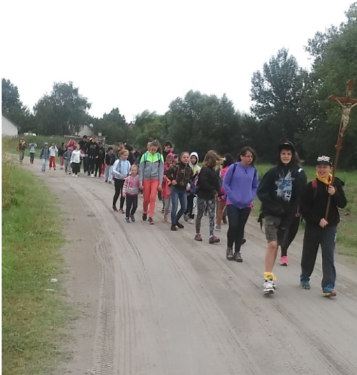
A hét folyamán közösen elzarándokoltak Üllésre