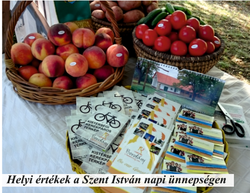
Helyi értékek a Szent István napi ünnepségen

Bordány is bemutatkozott Ópusztaszeren augusztus 20-án a Csongrád megyei Szent István napon. „Minden, ami Csongrád megye!” - ezzel a jelszóval rendezte meg Szent