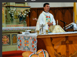
Új kenyér megáldása