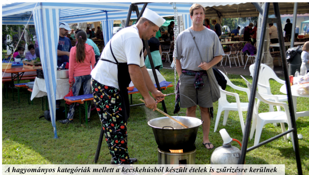
A hagyományos kategóriák mellett a kecskehúsból készült ételek is zsűrizésre kerülnek

Szeptember 10-én, a Faluháznál rendezik meg általános iskolás diákok és szülei, osztályfőnökeik és tanáraik versengését, az úgynevezett „Osztályharcot“! A megmérettetésre egy-egy osztályból 7 fős csapat nevezését várják, amelyből két főnek szülők vagy tanárok közül kell kikerülniük. A viadal lényege az, hogy az osztályok a nap folyamán pontokat kapnak a különféle feladatokban való részvételért, így a főzőversenyen való indulásért, valamint a kecskeverseny játékos feladataiban való részvételért. Az osztályoknak már most érdemes megkezdeni a felkészülést a Park téri rendezvényre, hiszen aszfaltrajz-, káposztadobó- és cipelő, kötélhúzó, kecsketejivó versenyben is meg kell küzdeniük sulis társaikkal. Lesz még lehetőség kecskehajtásban is megmérkőzni, kecskefejsben, számítógépes játékban és ki mit tudban számos feladat várható, valamint csapatonként egy fémkecskére, azaz biciklire is szükség lesz. Természetesen a verseny legjobbjai értékes ajándékokra számíthatnak, így alsó és felső tagozaton a legjobb három osztályt külön díjazza. A nap abszolút győztesének jutalma egy osztálykirándulás lesz, így mindenképpen érdemes lesz részt venni a IV. Kecseversenyen és a Helyi Ízek Fesztiválján!