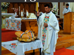
Új kenyér megáldása