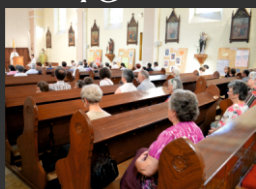
Új kenyér megáldása