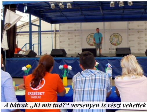
A bátrak „Ki mit tud?” versenyen is részt vehettek