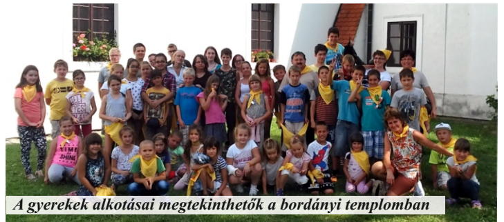
A gyerekek alkotásai megtekinthetők a bordányi templomban

Augusztus 8-12-ig került megrendezésre a Bordányi Kincskereső Hittanos Tábor. Immáron negyedik alkalommal vehettek részt a fiatalok ezen a programon. Idén 42 gyermek vállalkozott arra, hogy maradandó lelki kincsek nyomába induljon. A program megvalósulását a Szeged-Csanádi Egyházmegye, a Szent István Király Plébánia és annak közösségei, hívei támogatták. Településünk számos intézménye is segítette munkánkat. Köszönet érte!