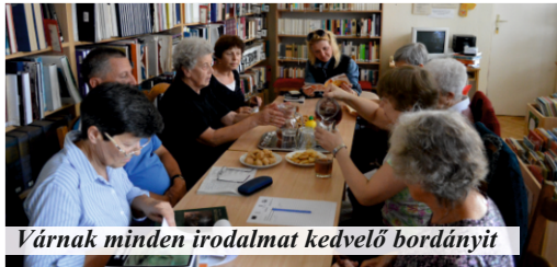
Várnak minden irodalmat kedvelő bordányit

2016. szeptember 14-én, szerdán 16:00 órai kezdettel a Faluház Községi könyvtárban felolvasóestet szervezünk. Kérjük, hozza magával kedvenc versét vagy prózarészletét, melyet felolvashat, vagy elmondhat. Várunk szeretettel minden irodalmat kedvelő kedves bordányit, felolvasóként és hallgatóként is, hogy egy csésze tea mellett eltölthesünk egy kellemes estét.