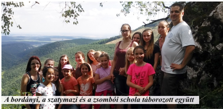
A bordányi, a szatymazi és a zombói schola táborozott együtt

Másnap reggel a zenés ébresztőt követően tornával frissítettük fel magunkat, melyet nagyközségünk kántorának öccse vezetett. Énekpróbával folytattuk a napot, melyben a szatymazi és a bordányi búcsúra készültünk a Szent István Király Zsolozsmájának tanulásával. Délután vezetőink az „Érzelmek Birodalmába” kalauzoltak bennünket, mely során játékosan ismerkedtünk különféle érzelmeinkkel, melyek betöltik mindennapjainkat. Mindezek után egy falu körüli sétán vettünk részt. A séta végeztével képeslapokat vásároltunk, melyeket másnap hazaküldtünk családunknak.