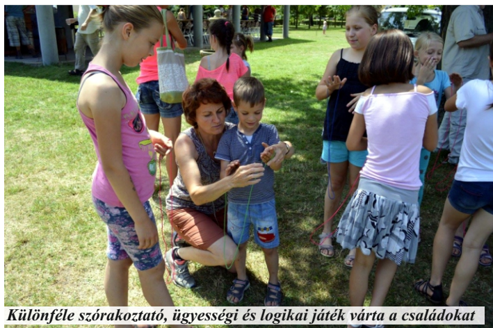
Különbféle szórakoztató, ügyességi és logikai játék várta a családokat