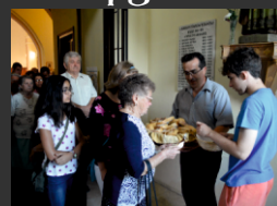
Új kenyér megáldása