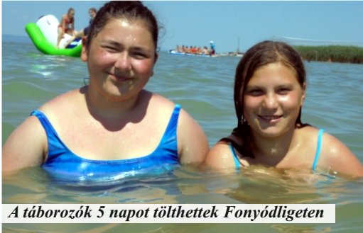
A táborozók 5 napot tölthettek Fonyódligeten

„Vasárnap korán reggel gyülekezőt szerveztünk a Faluházhoz. Mindenki izgatottan, bőrröndökkel és útitáskákkal felszerelve várta a kisbuszt, amely elszállít minket a fonyódligeti Erzsébet-táborba. Hamarosan meg is érkezett, ezért elbúcsúztunk szüleinktől és útra keltünk. Az út kb. négy órahosszáig tartott.