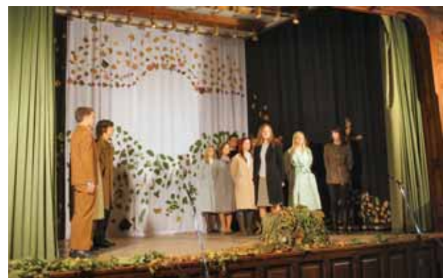
Jelenet az ünnepi műsorból