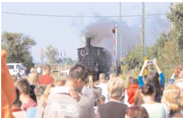
... és jött a gőzös