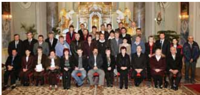
25 éves jubiléus házaspárok