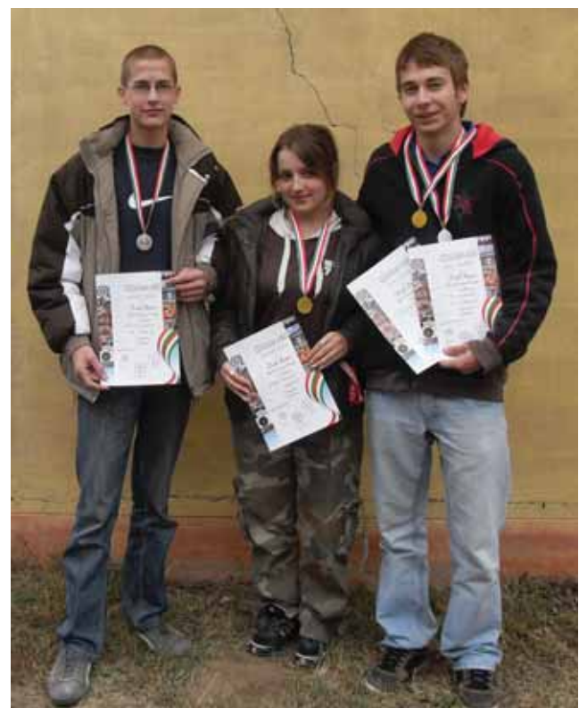
Bajnokok és helyezettek