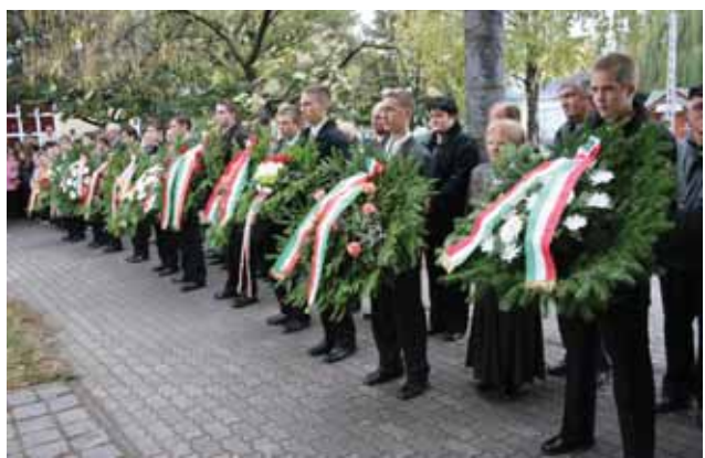
Koszorúzó az emlékmű előtt

ti: 1956-ban létezett a nemzeti egység, ugyanakkor azonnal felteszi a kérdést, vajon vesztet forradalom volt-e?