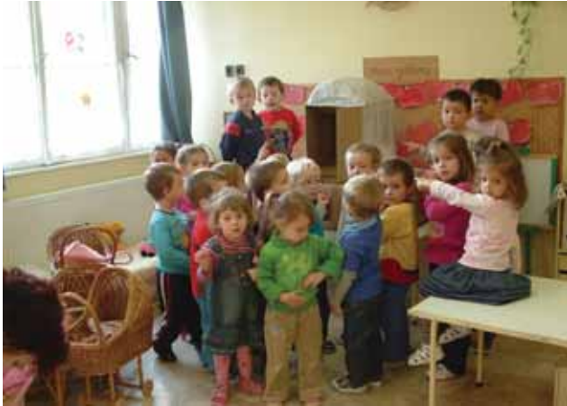
Nebéz kitarató munkával, de elkészült a kasírozott kemence

A mondóka segítségével a lányok bedagasztották a kenyeret, miközben a fiúk nagy