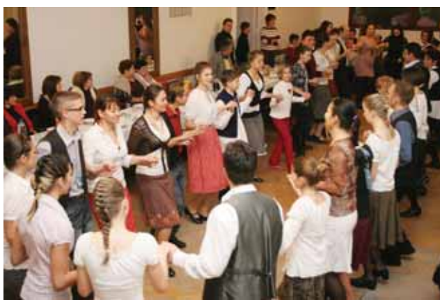
Működik a játszótér és a táncbál