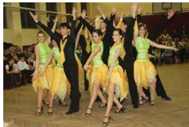
Fortuna formáció 2010