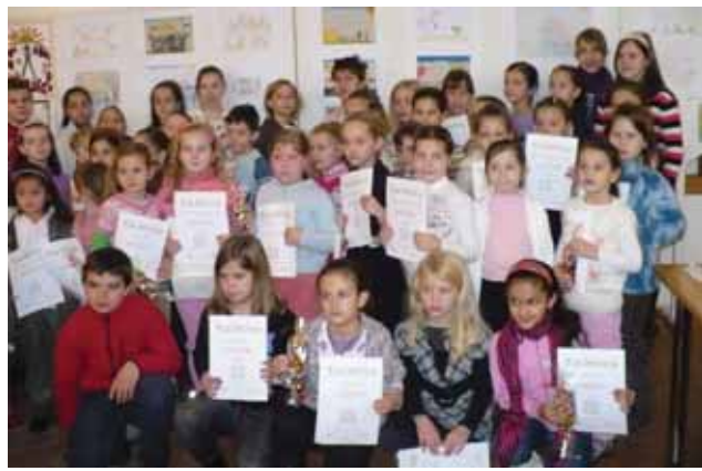
A Parázs rajzpályázat résztvevői