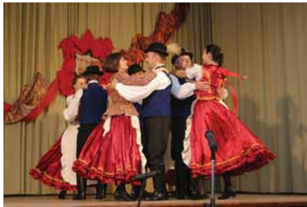
A tíz tánc egyike

Az est további részében tánc házzal és közös énekléssel vártuk a lelkes közönséget és mi tagadás, mi is az izgalom elmúltával a jóleső fáradtság érzésével vetettük bele magunkat a mulatásba. Ma már ritkaság számomba megy élő ze-