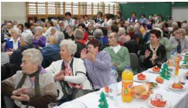
Tetszik a műsor