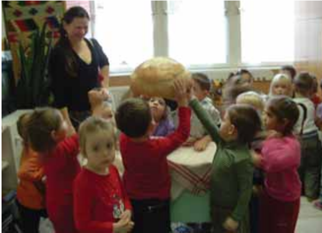
Ilyen nagy kenyeret sütöttünk

izgalommal gyűjtötték a rőzszt és játékból tüzeltek a kemencébe.