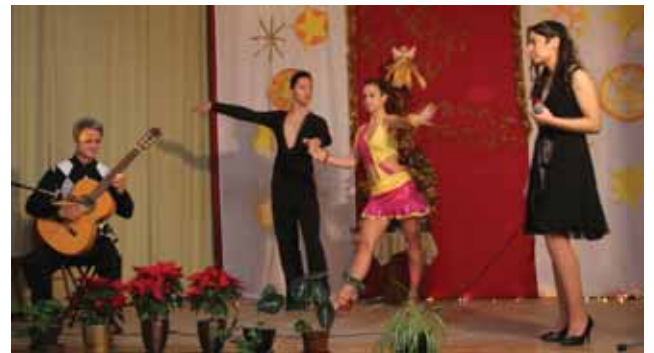
Az ünnep a fellépő vendégekkel