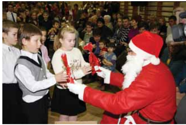
A gála névadója is megérkezett