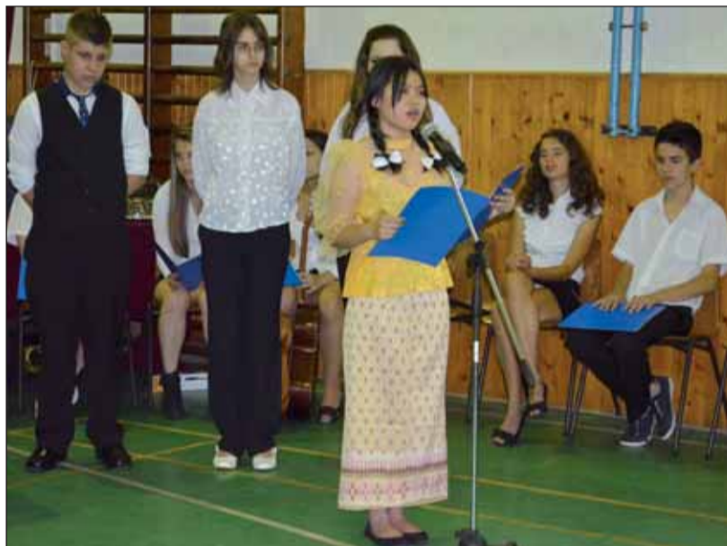
Ming thai viseletben mondta el beszédét