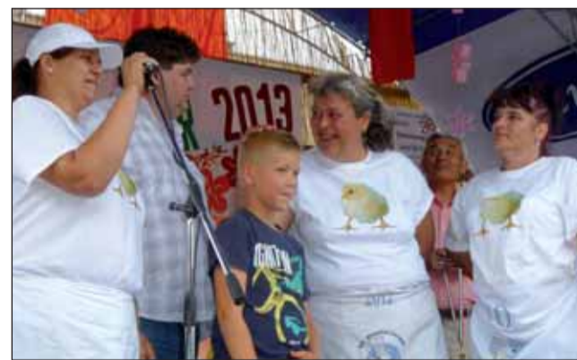
Az egyéb kategória győztesei a Napos Csibék

A főtéri színpadon közben már a helyi művészeti csoportok adták át egymásnak a világhírt jelentő deszkákat. A nyári hőséget enyhítő szél