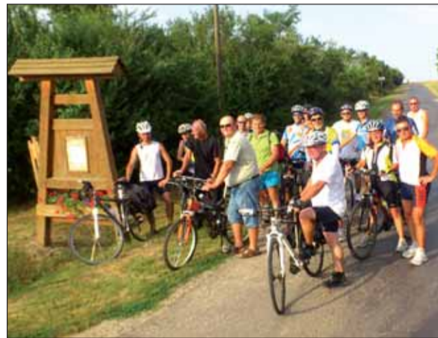
Kerékpáros érkezés Újireg Boldogságfalva táblájánál

központban felállított szabadtéri színpadon fel is léptek, de szerepelt az ireg-