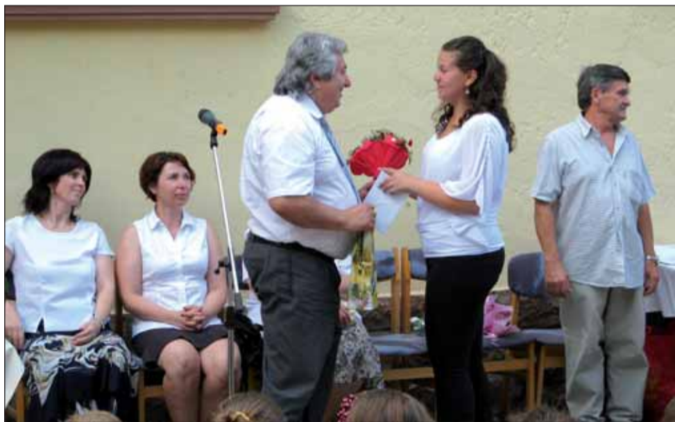
A diákönkormányzat búcsúzik az igazgató bácsitól

A nyár a legtöbb gyerekeknek a gondtalan kikapcsolódást jelenti, ám azon tanuló-