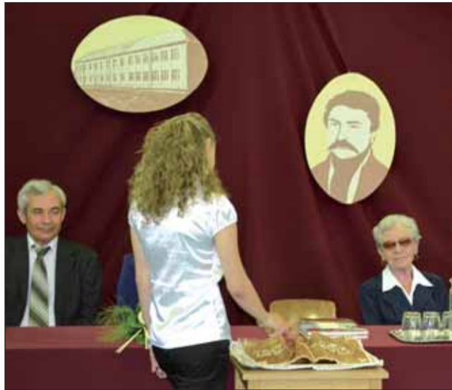
Széttörök a 2012/2013-as tanévet jelképező tortát

A Hamza Múzeum „Regék szárnyán” címmel indított