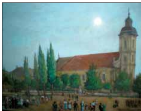
Templomunk tornya a Csörsz-árok töltésén áll. (Töröcsik Andor festménye 1938-ból.)

minden fényesebb napon el-elönti a rónaságot, mintha folyvást fenn akarná tartani egykori ősenek, a valaha itt hullámzott igazi