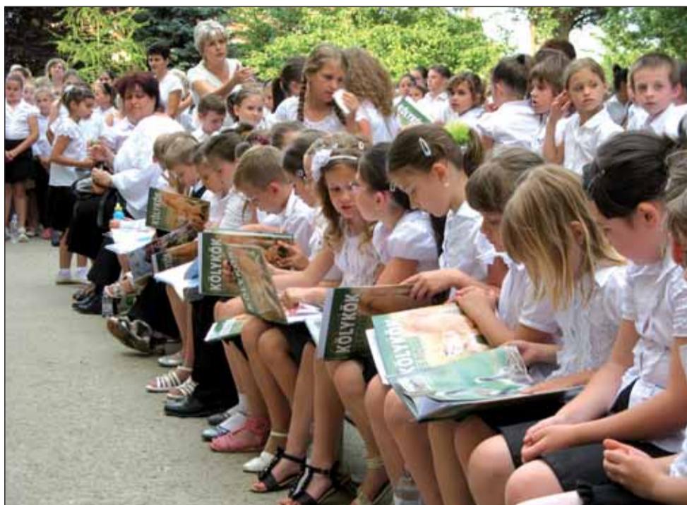
A legjobb tanulók jutalmkönyveikkel

E szó hallatán diákjaink szeme felcsillan, arcukon derű jelenik meg, mert ekkor elkezdődik számukra a pihenés, a feltöltődés ideje. Nincs több dolgozat, felelés, készülés, kora reggeli kelés, lehet lustálkodni, barátokkal több napra közös programokat tervezni. 182 tanítási nap után június 20-án csaknem 600 diákunk vehette át munkája elismeréseképpen a bizonyítványát. Ezt a napot talán az a 80 első osztályos várta a legjobban, akik most először olvashatták a szöveges értékelésüket munkájukról.