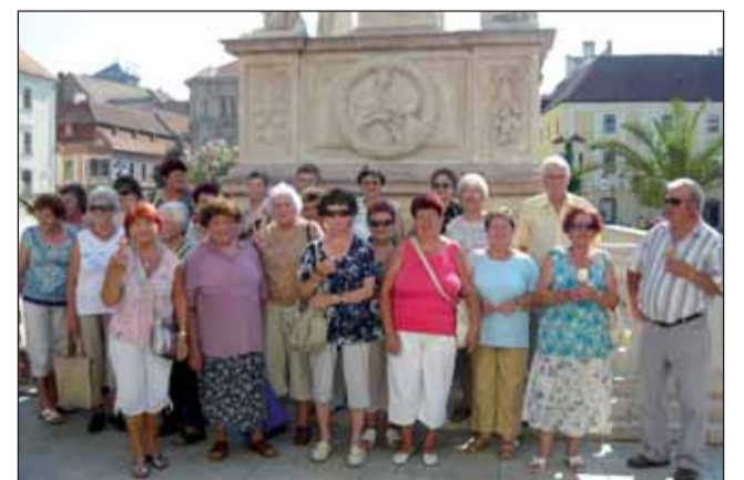
Rövid pihenés Győr főterén