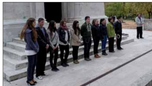
Koszorúzók a Deák-mauzóleum előtt

likus alakja – bizonyos értelemben Deák politikai ellenfele – szintén a Nemzeti Sírkertben nyugszik. Az épület 1909-re lett kész, és jelenleg is