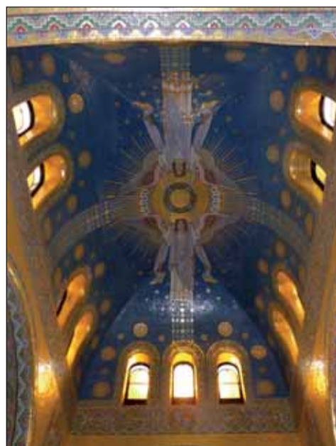
A Kossuth-mauzóleum mennyezete

egész napot, jól éreztük magunkat. Sokkal izgalmasabb volt, mint az iskolában ta-