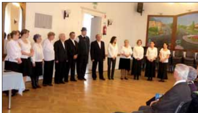
A Rozmaring Népdalkör színesítette a programot