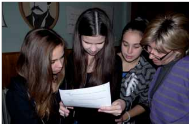
Az idegen nyelvi akadályversenyen még a tanári segítség is elkélt

Érdekes és izgalmas kémiai kísérleteket figyelhetünk meg és idegen nyelvi akadályversenyen vehettünk részt 2013. november 5-én a Deák Ferenc Gimnázium, Közgazdasági és Informatikai Szakközépiskola második Deák-délutánján.