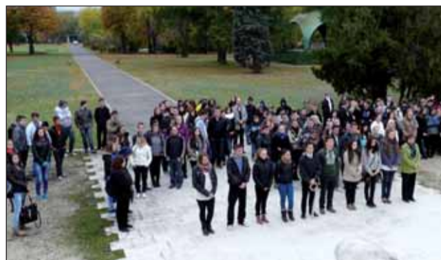
Az egész iskola kirándult

Igazán érdekesnek és tanulságosnak tartottuk az