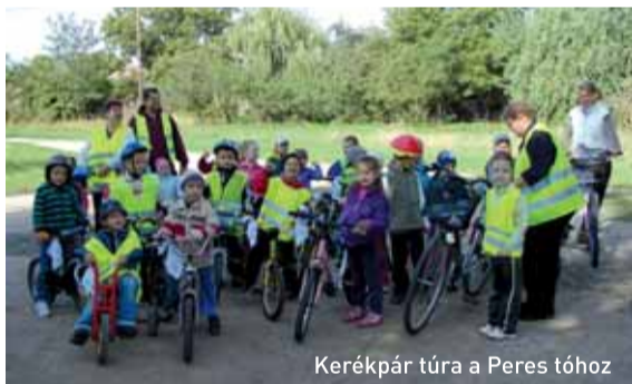
Kerékpár túra a Peres tóhoz

Az „Adjunk esélyt a jövőnek - Újszerű pedagógiai eljárások, módszerek bevezetése a jászárokszállási óvodákban.” című pályázathoz kapcsolódóan nekem kellett megvalósítani a napsugár csoportban az Egészségnapot az Egészséges életmódra nevelés projektben belül, melynek a „Fussunk, szaladjunk, had lobogjon a hajunk” címet adtam. Az egészség nagyon komplex dolog, amelyből