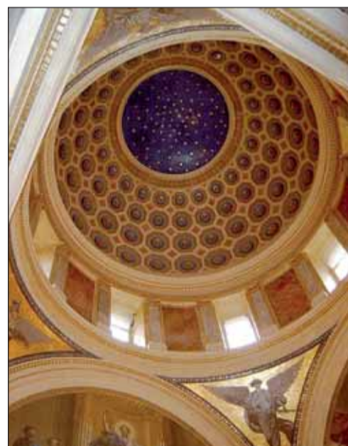
A Deák-mauzóleum kupolájának mennyezete

mint gyűlölni ellenségeinket. Kockáztathatunk mindent a hazáért, de a hazát kockáztatnunk nem szabad.” (Deák Ferenc, 1861. május 13.) A Deáktól övező kultuszról, az síremlék építésének történetéről idegenvezetőnk hosszasan beszélt nekünk. Tőle tudtuk meg, hogy nemzeti összefogással, közadakozásból épült a mauzóleum. A „haza