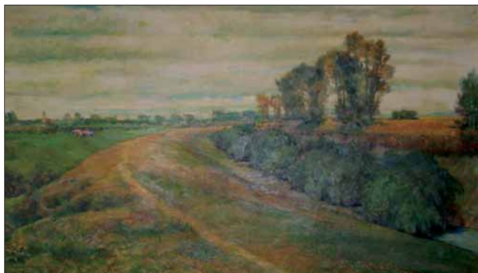
Gyöngyös patak a Csörsz-árokban

ilyenek voltak például a Dél-orosz sztyeppéken, a Meo-tisztól a Taurusz hegységig húzódó területen. Ezekről