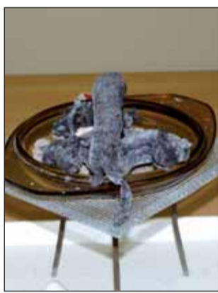
...és a „végtermék”

Összességében elmondhatjuk, hogy mindkét program sikeres volt, sokat tanultunk: biz-