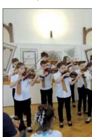
A hegedű művészei

Úgy gondoltuk, hogy már nem lehet ezt a csodálatos élményt tovább fokozni, de nagy örömeinkre, tévedtünk. Ami-