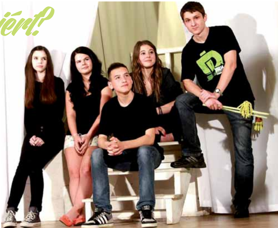
Tanár úr, de miért?

„Tanár úr, de miért?” címet kapta előadásuk, amelyből könnyen kiderül, hogy egy iskolai darab megvalósításának nehézségei közben láthatjuk, és