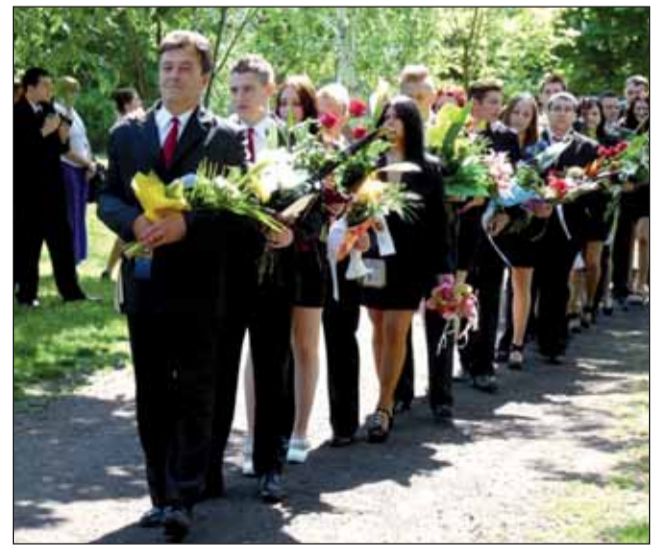
A 13. b osztály

most itt állunk, sokat köszönhetünk iskolánknak. Mindannyiunkat formált és nevelt mind az intézmény, mind tanáraink, éppen úgy,