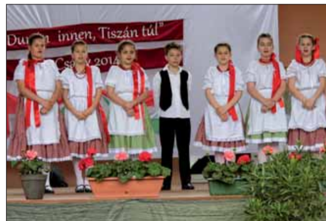
Szépen szólt az ének a Gyöngykoszorú előadásában