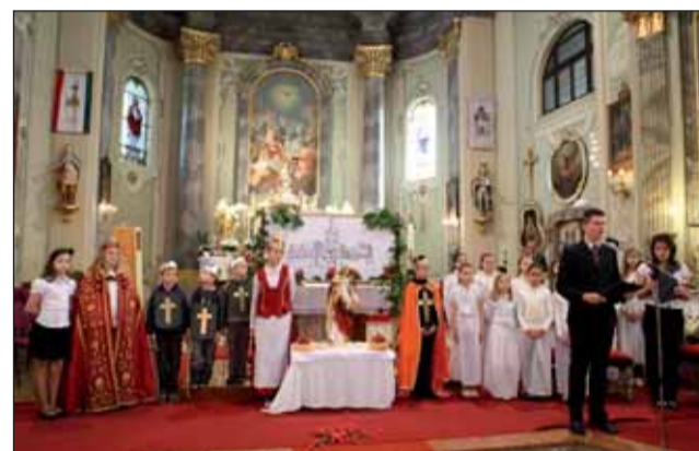
Jelenet Szent Erzsébet életéből

példát arra, hogy hogyan lehet segíteni a rászoruló embertársainknak. Az ember testből és lélekből áll, nekünk az a feladatunk, hogy a rászoruló embert segítsük. Sok