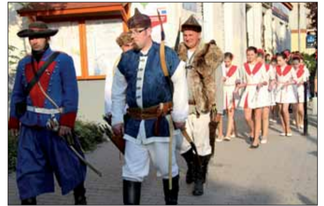
Hagymányórzó menet a koszorúzáshoz