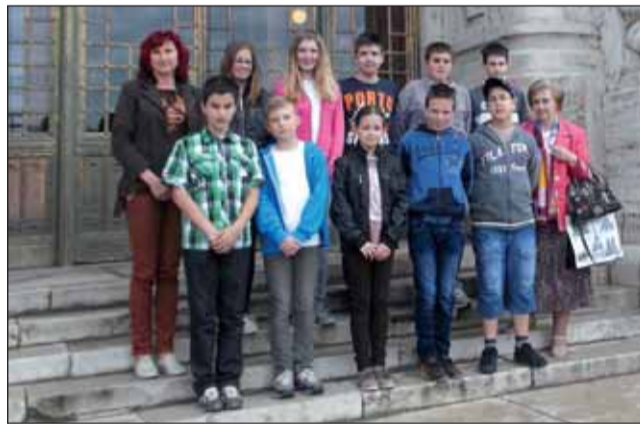
Az angol verseny legjobbjai és felkészítő tanáraik

Április 24-én az Országos Mesevetélkedő megyei döntőjén iskolánkból a 3. osztály Királyok csapata vett