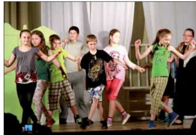
Tom Sawyer és társai