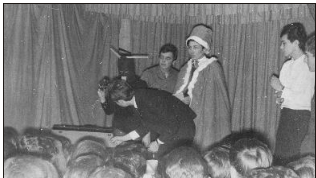
Mi van a Mikulás zsákjában?