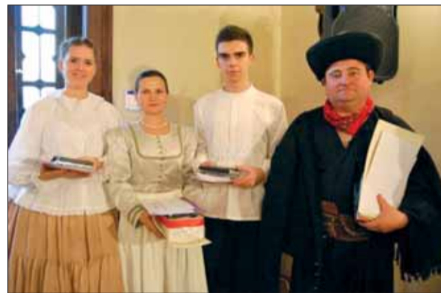
A XXIII. Hajnal Akar Lenni nemzetközi Kárpát-medencei népdaléneklési verseny négy dobogója a nagykárolyi kastélyban

forintos díjhoz, még 1 hetes jutalom táborozás is jár az Örkécei Népdaléneklési Versenyt, Csutorás Népzenei Táborba.