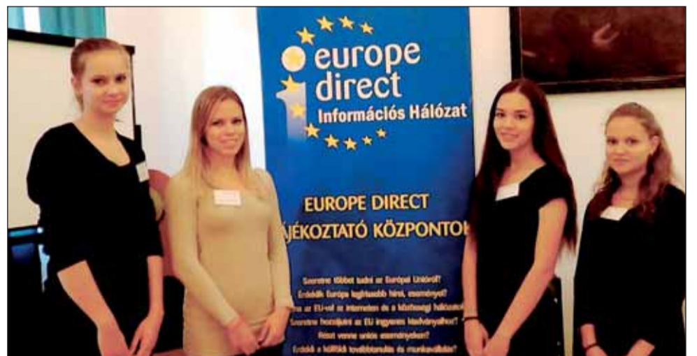
A négy muskétás

sági és Informatikai Szakközépiskola „Négy Muskétás” csapata a 256 induló csapatból a regionális 7. és megyei