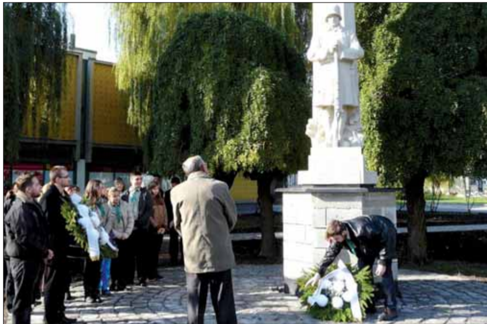
Koszorúzás az I. világháborús emlékműnél

A hagyományoktól eltérően az Árokszállásiak Baráti Köre /ÁBK/ emlékező koszorúzás nélkül, november 7-én 10 órára hívta tagságát éves rendes közgyűlésére. Az emlékező koszorúzást a városi emlékhelyeknél ebben az évben november elsején, Minden-szentek napján tették meg.