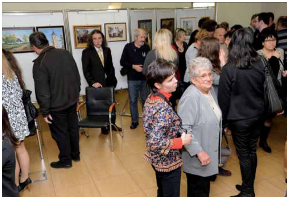
Pillanatkép az érdeklődőkről

A nyolc kiállító zöme itt is jász kötődésű volt.