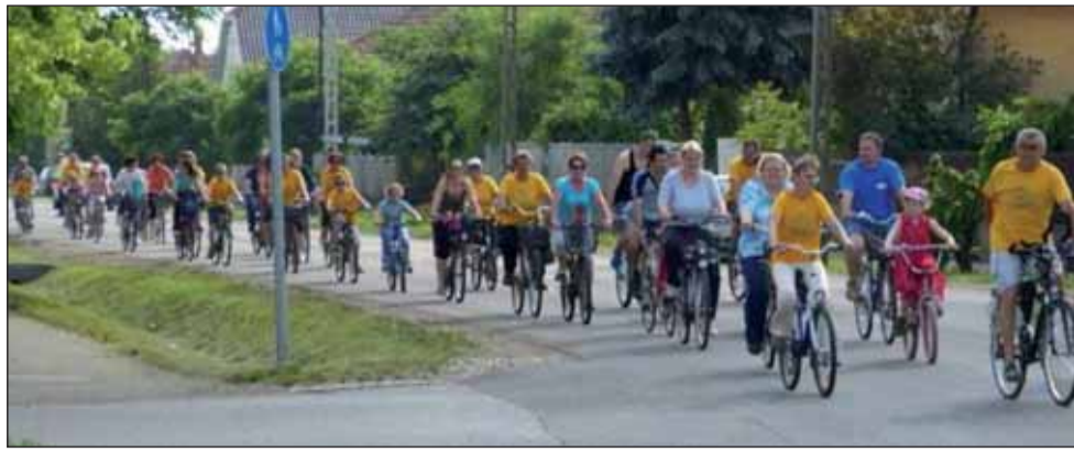
Az ez évi Kihívás Napja május 25-én a megszokott helyszíneken és programokkal várja résztvevőit