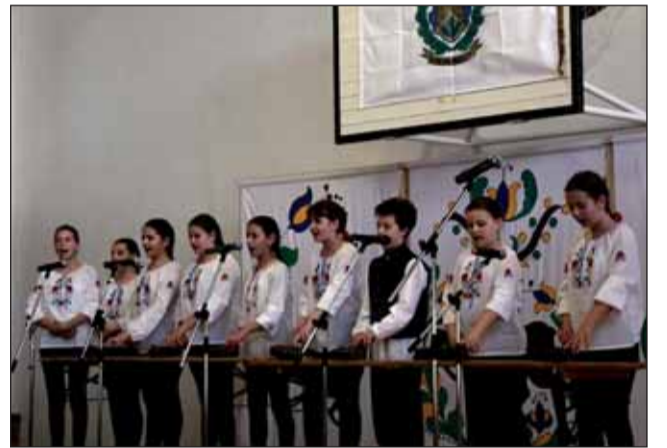
Egyszerre szólt a citera a Délibáb tagjai kezében

Április 22-én, ha valaki figyelte iskolánk környékét, meglepődve láthatta, hogy ezen a reggelen a megszokottnál kevesebb autó par-