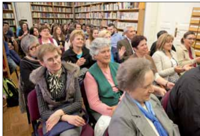
A Költészet napi megemlékezés közönsége