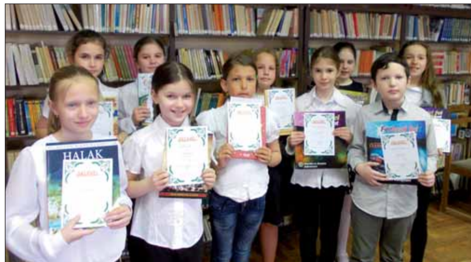
Az Aranyszáj szépolvasó verseny győztesei