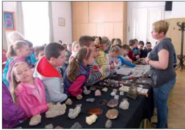
Megnézték, megfogták, megcsodálták, megvették Földünk kincseit

Az előadás végén mindenki közlőre is megcsodálhatta Földünk rejtett kincseit, kezébe vehette, megtapogathatta, megcsodálhatta,