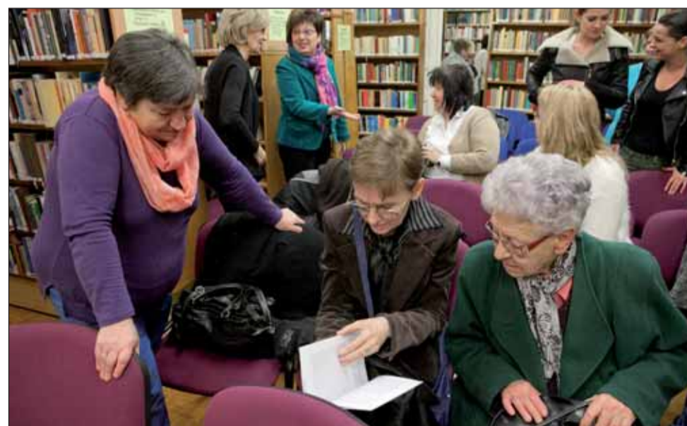
Ismerkedés a kötettel