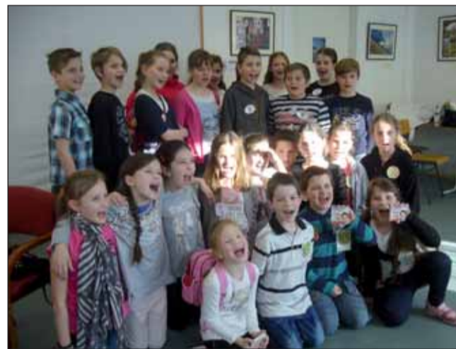
Mesevetélkedő körzeti döntőjének résztvevői

Április 26-27-én a szülői munkaközösség papírgyűjtést szervezett, ezzel is csatlakoztunk a Föld napjához. Április 22-én a 6. b osztály a vadászársasággal, április 28-án iskolánk alsó tagozatos tanulói csatlakoztak az országos