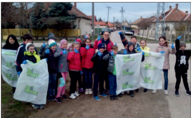
Indulás a szemétyűjtésre

Az emberiség jelenlegi legnagyobb kihívása a környezeti válság. A környezettudatosabb életvitel kialakítása a válsággal való megküzdés egyik fő eszköze. Ehhez a célkitűzéshez járulnak hozzá az ökoiskolák iskolafejlesztő munkájuk során azzal, hogy a jövő generációk nevelése során a környezettudatosan cselekvő állampolgár eszményképét tartják szem előtt.