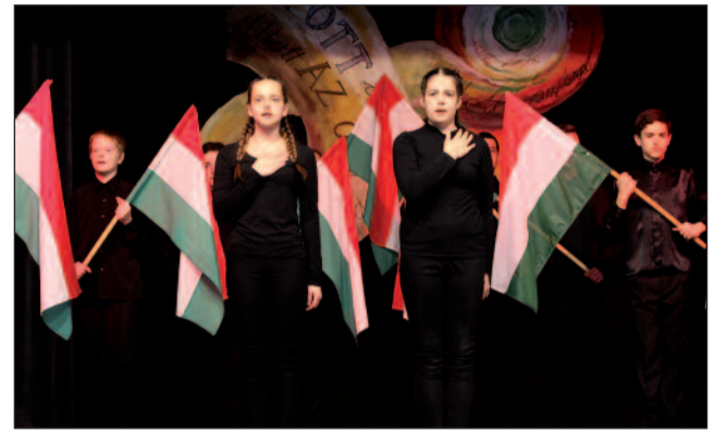
Részlet az előadásból

Petőfi, Jókai, Vasvári, Tánccsics, Kossuth, Széchenyi, Bem, Batthyány, Damjanich és még sorolhatnánk azoknak a hősöknek a neveit, akik elindították, folytatták és befejezték az 1848/49-es szabadságharcot. A hősöknek a nevét csak töredéké-