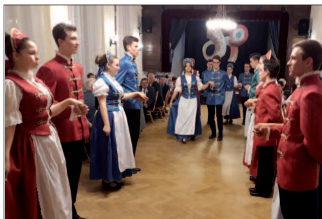
A Fortuna TSE megnyitja a vacsorát