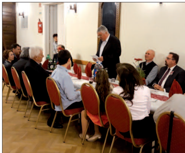
Köszöntőt mond a Gazdakör elnöke