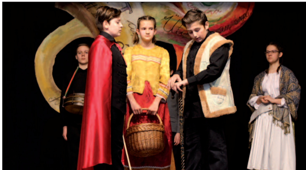
Jelenet az ünnepi műsorból

„Szolgáltam, szolgáltam, mindig csak szolgáltam. És halálommal is szolgálni fogok. Forrón szeretett magyar népem és hazám, tudom, megértik ezt a szolgálatot.” /Aulich Lajos/