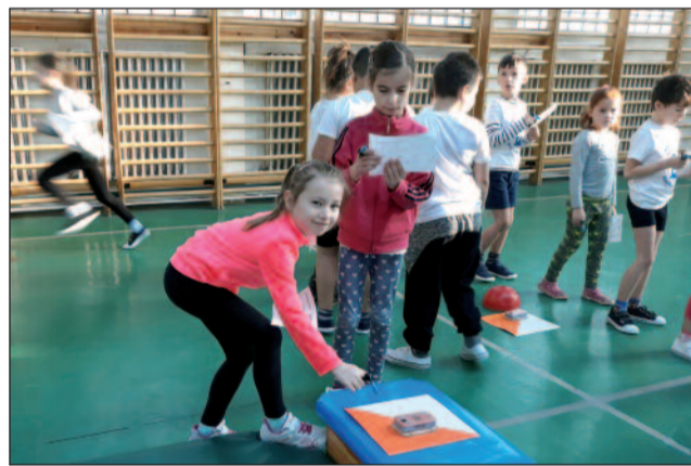
Tájfutás az iskolában

Márciusban búcsúztunk a téltől és köszöntöttük a tavaszt, mely meghozta a tél után a várt jó időt. Ez évben a kellemes idő egy kicsit korábban köszöntött be – valószínűleg azért, mert a farsangi bálon jól kivertek a gyerekek