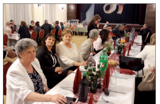
A vacsora résztvevői