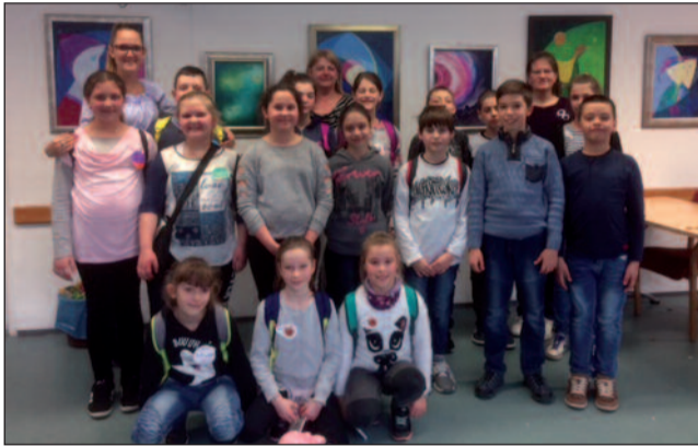
A mesevetélkedő versenyzői és felkészítőik

A tavaszi kellemes idő, a természet ébredése mindannyiunkat kicsalogat, úgy ahogy Petőfi Sándor írta Ki a szabadba! című versében. Ami-