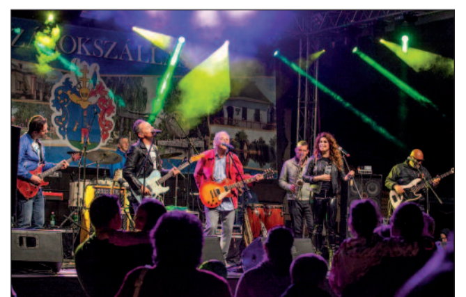
Színpadon az LGT Zenevonat