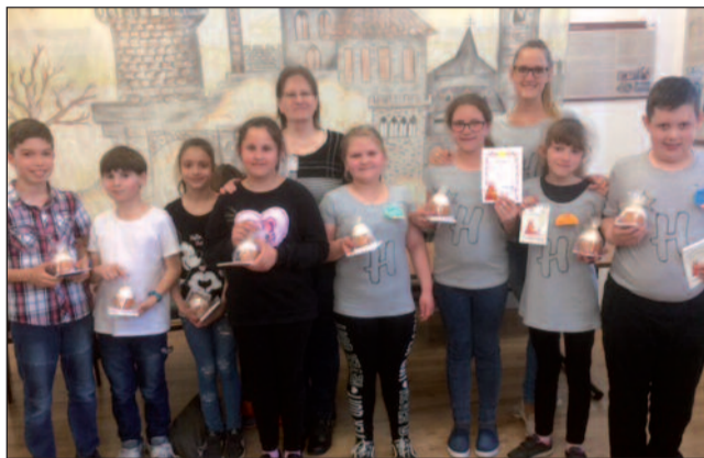
Az Országos Mesevetélkedő megyei döntősei és felkészítőik

idei játék keretét magyar népmesék adták. Benedek Elek születésének 160. és halálának 90. évfordulójára emlékeztek a szervezők, ezért a vetélkedő meséit az ő meséi közül válogatták.