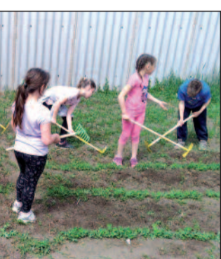
Szorgos kezek a kiskertben

Május az utolsó hónap, mikor még a versenyekből az országos megmérettetéseket voltak hátra.