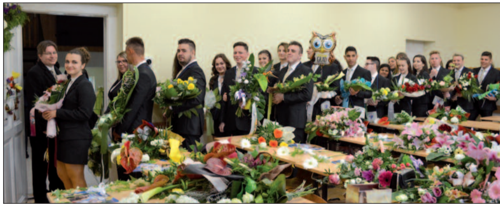
A 12. A osztály

A Deák Ferenc Gimnázium, Közgazdasági és Informatikai Szakgimnázium végzős diákjainak ballagási ünnepségét 2019. május 4-én tartottuk. Az esős, hűvös idő miatt a tornaterem volt a rendezvény helyszíne, amelyet zsúfolásig megtöltöttek a hozzátartozók és érdeklődők.