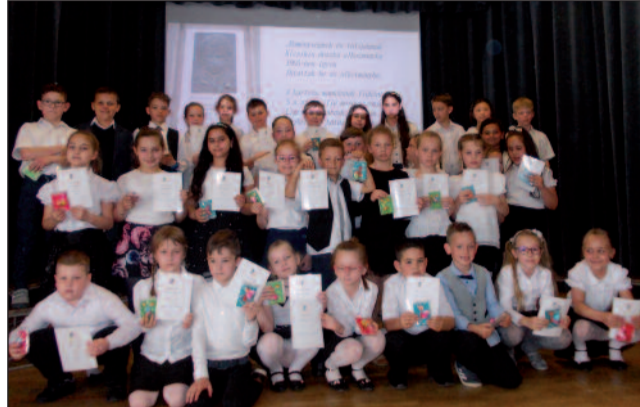
A versmondó nap résztvevői

Egyre nagyobb értéknek kell tekintenünk, ha tanítványaink az iskolai feladataikon, elfoglaltságaikon túl, a modern kor kísértései mellett időt szentelnek arra, hogy megtanuljanak egy verset. Kitartás, türelem kell ahhoz,