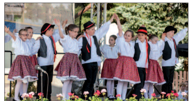
Részlet a Hidi Tánciskola műsorából