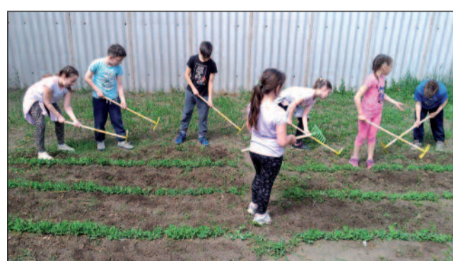
Szorgos kezek a kiskertben

alapítványhoz. Iskolánk tanulóinak óta kiváló eredményeket érnek el ezen a versenyen. Idén három kategóriában lehetett pályaműveket készíteni: Én kis kertem, Háziállatom viselkedése, gondozása, Vízparton vagyok. A legjobb oklevelet, jutalomkönyvet kaptak. Az ünnepélyes eredményhirdetés 2019. április 27-én volt Szegeden, a Somogyi Könyvtárban.