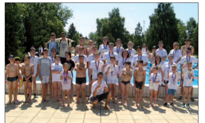
A TRIATLON verseny résztvevői és nyertesei