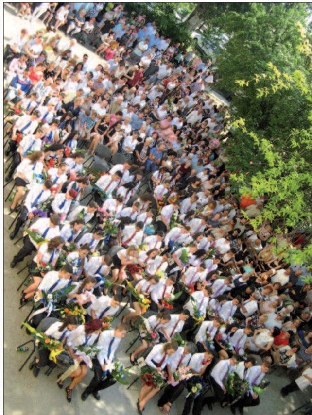
Ballagó diákjaink és osztályfőnökeik

nézni, soha ne feledd, honnan indultál, s kik segítettek neked az utadon!”