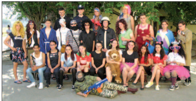
8. a osztály

Június 17-én nem csendesedett el iskolánk udvara, mert a nyári szünet a tavalyi évnek megfelelően indult. Az „EFOP-3.3.5-17-2017-00020 Bentlakásos és napközis tematikus programok megvalósítása a Jászberényi Tankerületi Központ általános iskoláiban” című nyertes pályázatnak köszönhetően június 17-21-ig az 1-2. osztályos tanu-