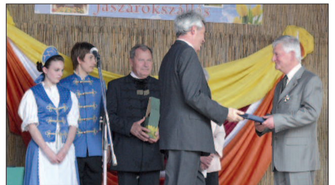
Dr. Szabó Béla 2010-ben átveszi díszpolgári kitüntetését.

ciós oklevelet, a vidéki főiskolák testnevelői közül elsőként. 2000-ben az MTA pályázata alapján nevezték ki egyetemi tanárrá. Az egri évek alatt (1973-2009) szinte felsorolhatatlanul sok tudományos munkában vett részt. Opponensként, bizottsági tagként segítette az ország felsőoktatásában dolgozó kollégák tudományos tevékenységét,