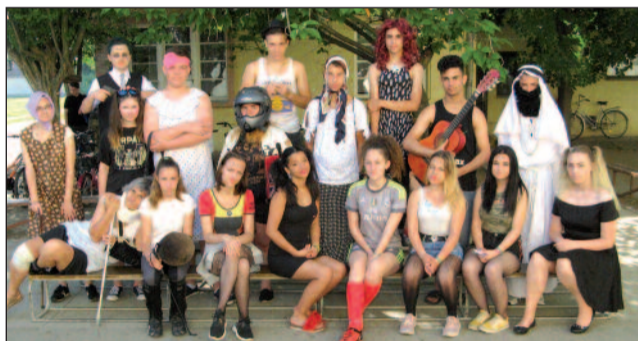
8. b osztály