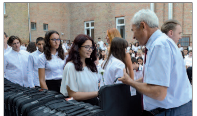
A laptopok átadása