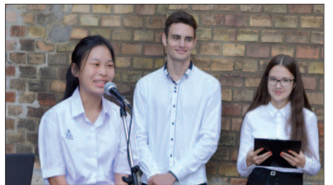
A thaiföldi cserediák

módszerek kipróbálásában, ha közelebb vihetik a diákokhoz a digitális technikákat, ha kitekintést tudnak nyújtani és ez további kérdéseket szül a diákokban, ha közösen, motiváltan tudnak készülni a tanulók a versenyekre. A tanárok jövőbeli célja az, hogy széles körű tevékenységgel a fenti sikerfolyamat tovább bővüljön.