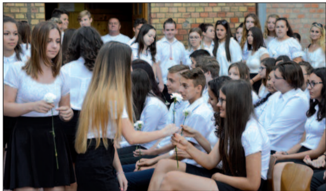
A 10-es tanulók köszöntik a 9-eseket

2019. szeptember 2-án, reggel 8 órakor tartották a tanévnyitó ünnepséget a Deák Ferenc Gimnázium, Közgazdasági és Informatikai Szakgimnáziumban. Ez