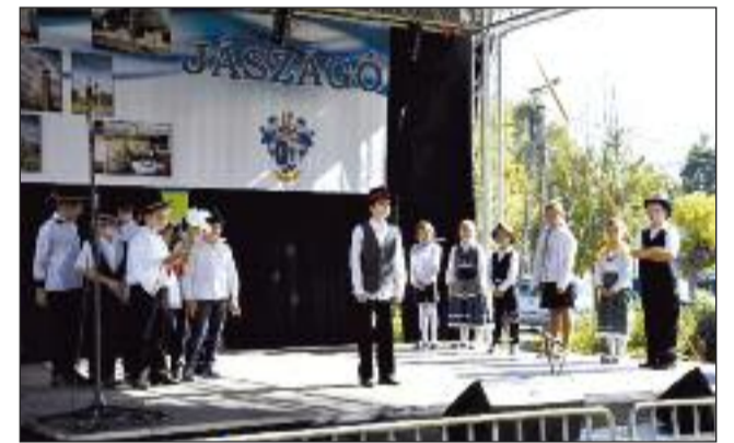
Őszi forgatag, az általános iskolások műsora