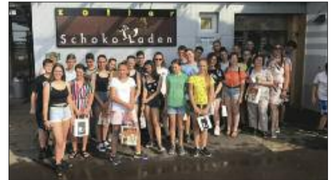
A zottari csokoládégyárban jártak a kiránduló gyerekek

híres Piccadilly-n sétálhattak, valamint ellátogattak a Kínai negyedbe, átsétáltak a Westminster-hídon, láthaták a híres Big Bent, valamint a parlament épületét. Voltak a kormányzati negyedben; igazán nagy élmény volt a Downing Streeten, a miniszterelnöki rezidencia előtt állni. E nap fénypontja a London Eye volt, ahol London panorámájában gyönyörködhetek. A harmadik napon Shakespe-