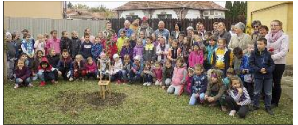
Az ültetők és az elültetett almafa

„A zene a legnagyobb jótémény, amit a halandók ismerhetnek.” – mondta J. Addison.