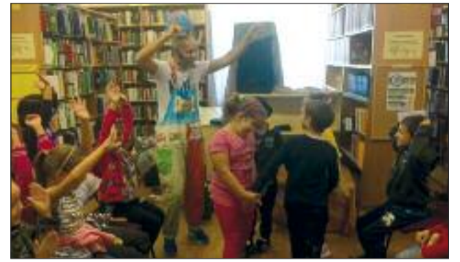
Mese és játék az előadáson