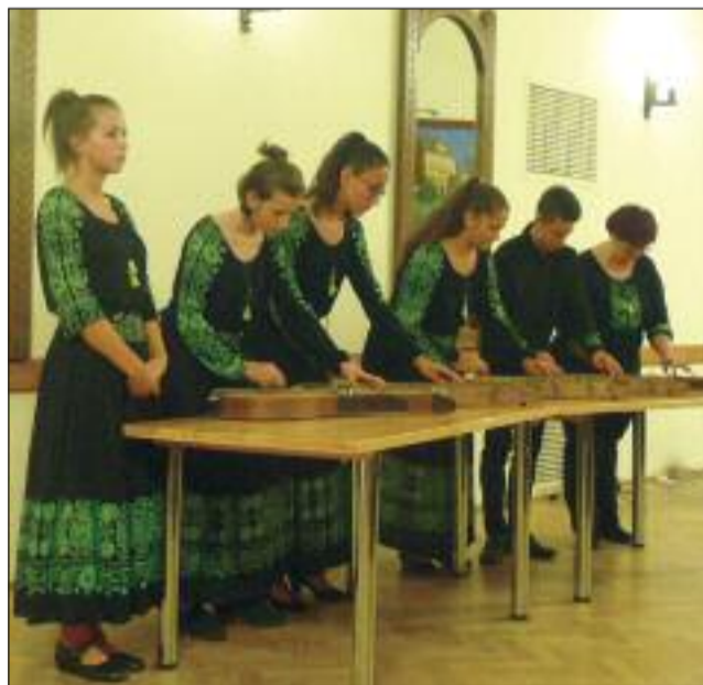
A Délibáb együttes citerajátéka

Hallhattuk a Délibáb Citerazenekart, akik moldvai dalmokokat játszottak és éne-