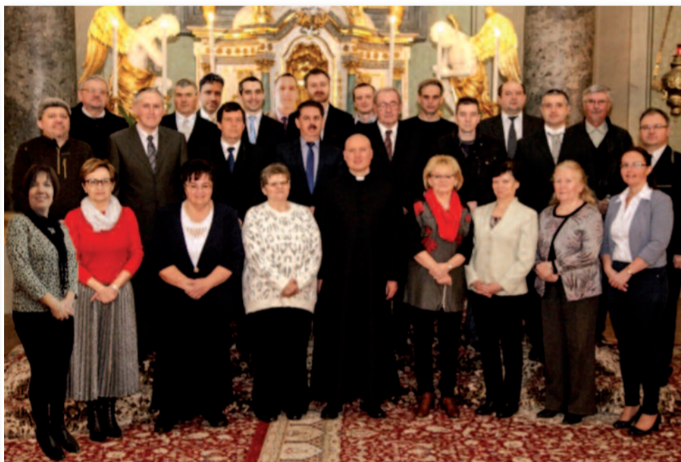
Egyházközség képviselő testület 2020

A jövőben szeretnénk saját honlapon láthatóbbá tenni magunkat, a facebook útján elérni bárkit, aki érdeklődik egyházközségünk élete iránt, és havi szinten szeretnénk tájékoztatni a Jászvidék olvasóit eseményeinkről.