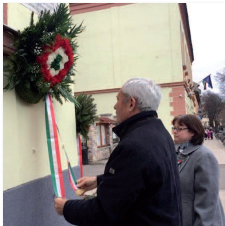
Emlékezés az 1848-49-es forradalom és szabadságharc hőseire

A kialakult egészségügyi helyzetre való tekintettel az idei év megemlékezései országszerte elmaradtak. Ennek ellenére városunk fontosnak tartotta, hogy fejet hajtsunk a márciusi ifjak előtt. Az önkormányzat, a helyi intézmények, civil szervezetek és pártok vezetői elhelyezték koszorúikat a Városháza falán található emléktáblánál. Az óvodások és az általános iskola alsó tagozatos tanulói saját készítésű, nemzeti színű zászlóikkal, rajzaikkal színe-