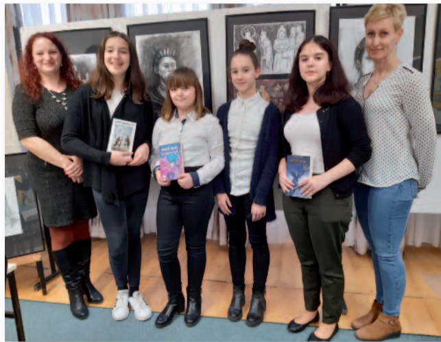
Szép magyar beszéd győztesei és felkészítő tanárai

seket postán kapják meg az érintett tanulóink, mivel az óvintézkedések miatt az eredményhirdetés március 11-én Mezőtúron elmaradt.