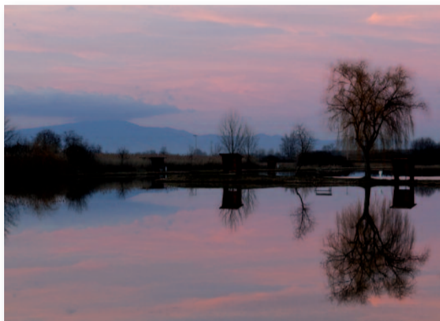
A győztes fotó

Az esemény végén a járványügyi veszélyhelyzet miatt Gyulavári Dániel élménybeszámolóját el kellett halasztani, de összességében egy jó hangulatú délutánon vehettem részt.