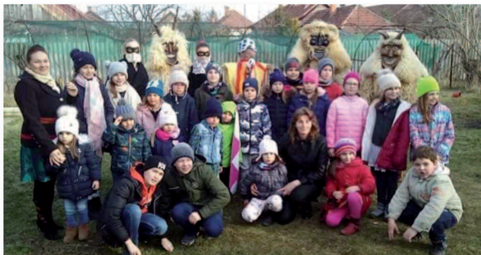
Közös fotó a busókkal

A busók a hagyományokhoz híven mindenkit ijesztgettek és összekócolták a hajukat. Láttunk sok bátor embert,