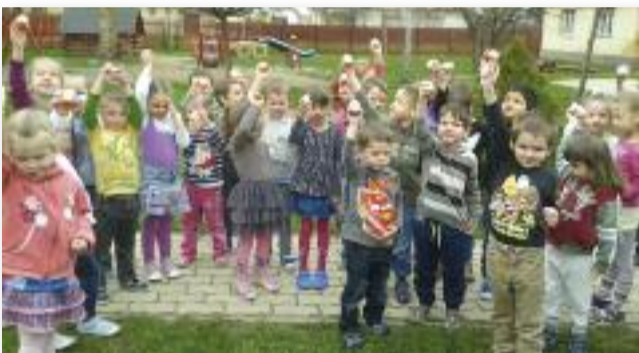
„Mindenki talált magának tojást?”

A húsvéti ünnepkör nemcsak fontos egyházi ünnep, de a gyerekek is örömmel vetik bele magukat a készülődésbe, a játékaiba.