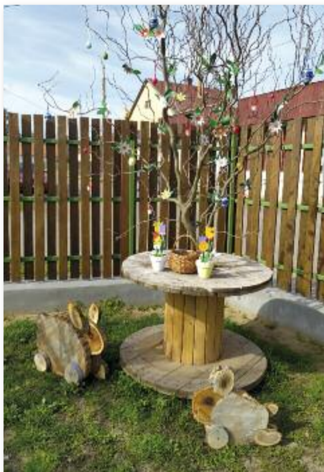
Az óvoda udvarai visszavárták a gyerekeket

Bár óvodáink több mint egy hónapig szinte üresen álltak, most már nagy szeretettel fogadjuk a gyerekeket, hogy megtöltsék vidámsággal és játékkal a csoportszobákat és az udvarokat.