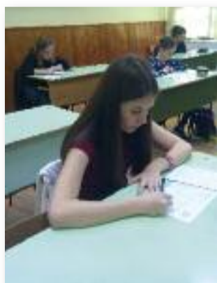
Nyelvész verseny az iskolánkban

az igényes és helyes nyelvhasználat elsajátítása, a nyelv sokszínűségének megismertetése, az érdeklődés felkeltése anyanyelvünk szépségei iránt, a nyelvi hagyományok ápolása a céljuk.