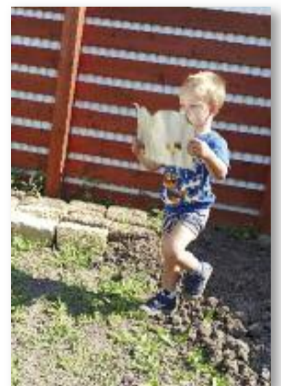
Keressünk kincseket a kertben!

Akár már ezt is elkészíthetjük együtt. Kezdeként főzzünk egy teát és hagyjuk kihűlni. Amíg a tea hűlik, nézzünk át gyermekünkkel néhány térképet. Hogyan jelölik a térképen a hegyeket, folyókat stb. Ezután vegyünk elő egy papírt és rajzoljuk meg a saját térképünket, amin bejelöljük a kincset is. Csavarjuk fel a térképet, és ha kihűlt a tea, tegyük bele. Kb. két órán keresztül ázzon, majd óvatosan vegyük ki és tegyük ki száradni. Közben rejtsük el a kincset, mikor gyermekünk nem figyel. Ha elkészült, kezdődhet is a kincskeresés!