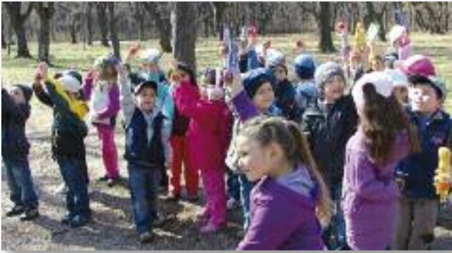
Ki gyűjtötte a legtöbbet?