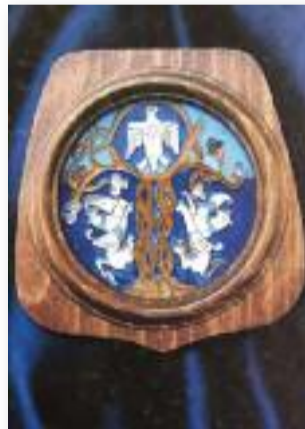
A Jászágóért Díj emléklakettje

rajzos lenyomata. Visszatérve a címre: Múlt idő - ezzel a gondolattal egy bizonyos kor