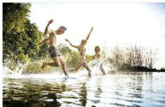
A kánikulában is biztonságban!

a hányinger, a hányás, a láz. A legjobb ellenszere a besötétített helyen való fekvés, hideg vizes borogatás, hányás- és lázcsillapító bevé-