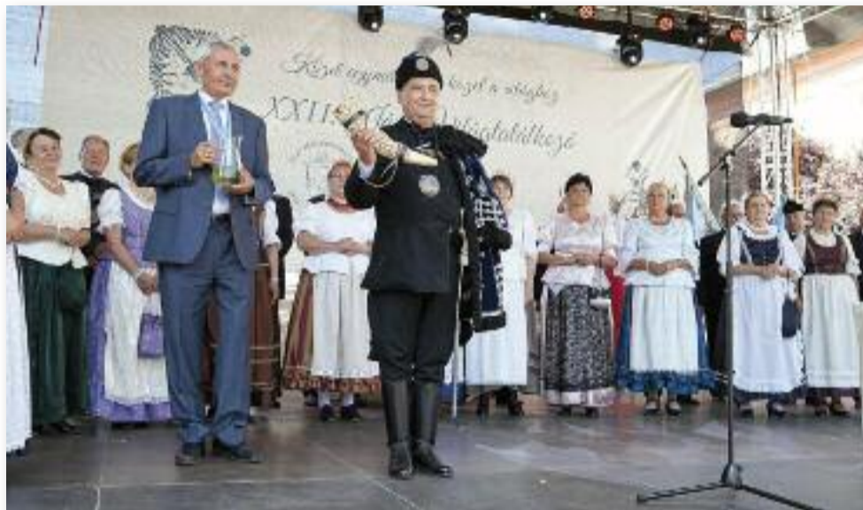
Jász Világtalálkozó, 2016.

A 2021. január 17. napjára kitűzött időközi választás a járványhelyzet miatt elma-